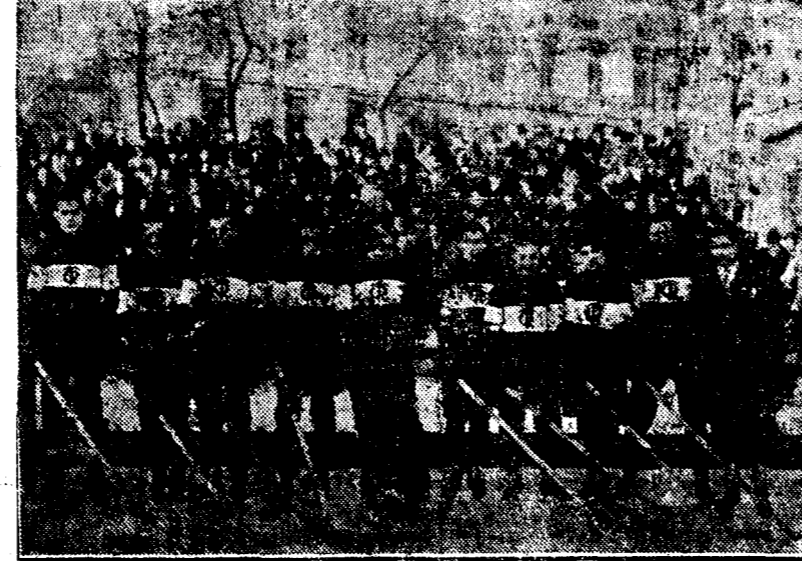
Tennis Clubul din alte timpuri