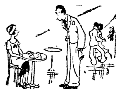
Bine, domnule, după ce m'ai ales ca dansatoare nu mai vî să mă învîț la tango! — Scuză-mă, dădule... Dar m'am retras și eu din alegeri.