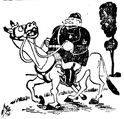
Don Colonel - greu mai ești mă! de galat decând fac cu Dv. serviciu la regiment! Usurează-ți puțin burta cu un Tip, căci de nu, manevrele la anul nu le mai facem. Am să fii dus la morga și are să-ți pară rău... În Tip te scaparea noastră.