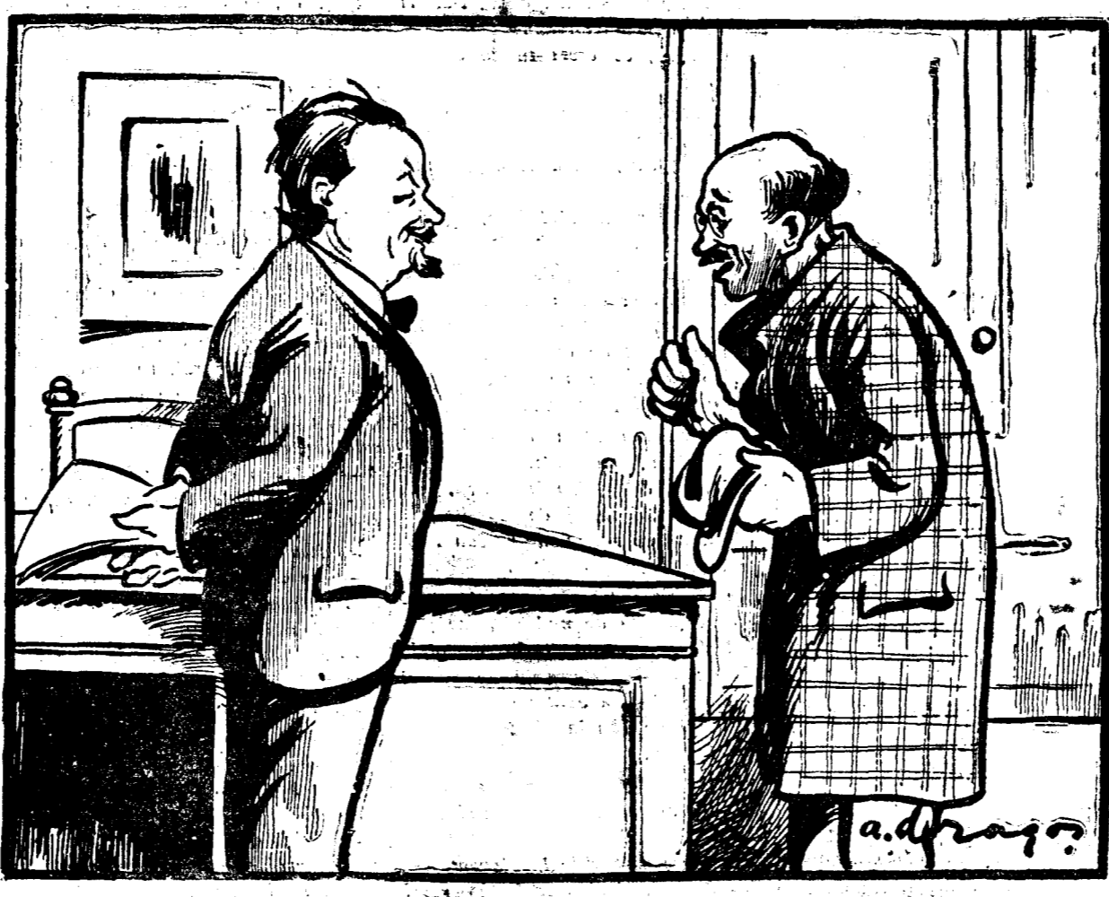
— E adevărat că vrei să rămâni primar al Capitalei, d-le Dobrescu? — Perfect exact. Până ce mai rămâne o casă nedărâmată în Bucu- rești, nu mă las!

Curentele pro și contra fostului sef al partidului