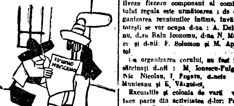
— Bine că măcar noi femeile nu suntem obligate să mergem la alegeri...