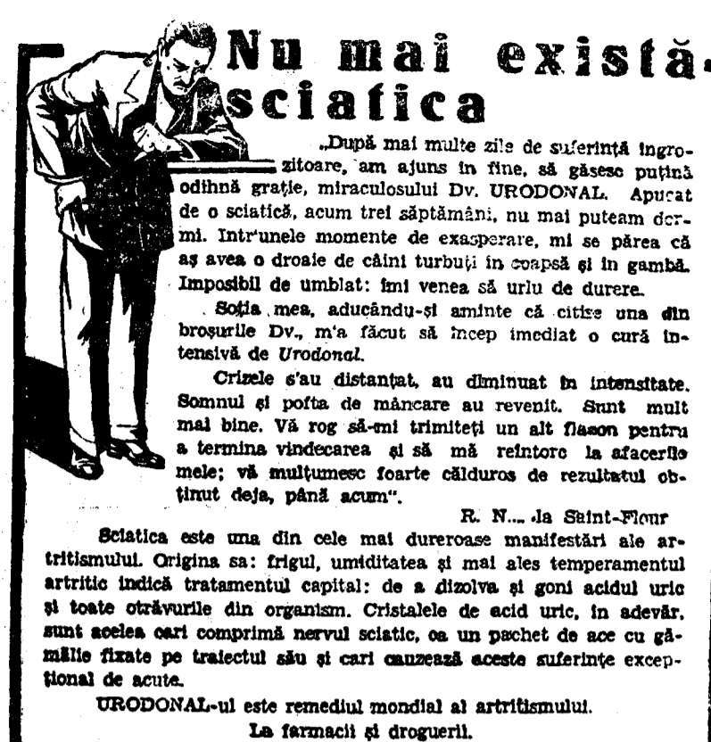
Sciatica este una din cele mai dureroase manifestări ale artritisului. Originea sa: frigul, umiditatea și mai ales temperamentul artritoid indică tratamentul capital: de a dizolva și gonă acidul uric și toate otrăvurile din organism. Cristalele de acid uric, în adevăr, sunt acelea care comprimă nervii sciatici, cu un pachet de ace cu gămile fixate pe tractul său și care cauzează aceste suferințe excepționale de acute.

rilor anarhice cari s'au accentuat agrăvându-se în ultimul timp. Voi căuta prin ajutorul Consiliului Superior al Magistraturii să fac cât mai rare abaterile dela datoria cari s'au semnalat la unele tribunale. În curentul de deprimare generală, determinat de motive, unele de ordin moral, altele de ordin material ce au săpat adânc încrederea pretudină, o magistratură al cărei prestigiu impune respect tuturor, este încă una din pinghiile cele mai solide de rezistență ce ne-au rămas. În amărăciunea zilelor de azi sentimentul de deplină încredere ce țara are cu drept cuvânt în magistratură ei nu trebuie străduincat. Voi cere deci tuturor inițiatorilor magistrați o supraveghere de aproape a indatoririlor ce incumbă corpului judecătoreș. Mă voi devota cu toată puterea mea de muncă în slujba marelui popor la unificării legislative”