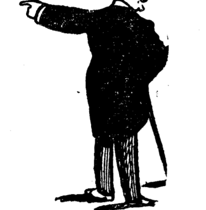
D. IULIU MANIU

Deasemenea, trebuie să arătăm ca în balanța hotărârii luate de către d. Maniu a atârnat și demersul telegrafic făcut pe lângă d-sa de către d. Vasile Rădulescu-Mehedinți, în numele unui important grup de parlamentari național-tărăniști din Vechiul Regat, cari l-au cerut să intre în acțiune, pentru menținerea unității partidului național-tărănesc.