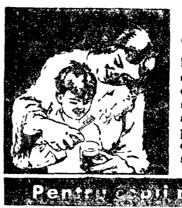
Pentru copiii născuți în ziua de azi