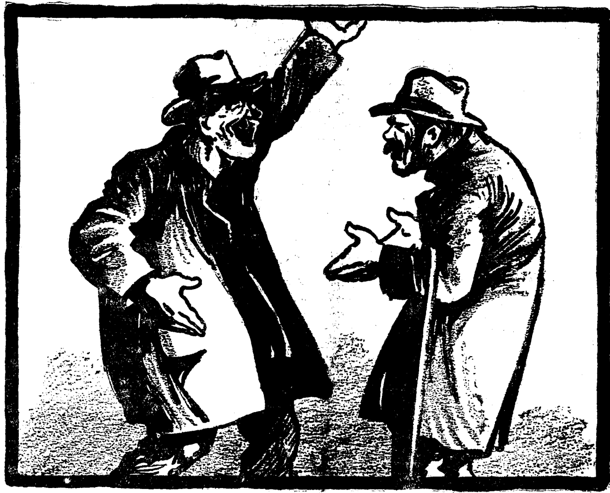
— Ura! S'a încheiat acordul cu creditorii străini... — Și ce te bucuri așa, koule? Dacă s'a încheiat acordul, o să trebuie să plătim!...