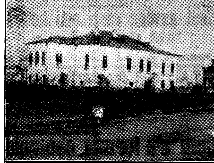
Biserica Sf. Dumitru și casa refăcută a bănelii lui Mihai Viteazu

cultului și Slavei Celui Atotputernic, Dumnezeu a vrut, că după 44 de ani de strădanie lucrările să se desăvârșească sub Domnia Majestații Voastre. 2. O școală își sărbătorește un trecut de muncă de peste un veac: constată rod insușit și simțindu-și prezentul justificat, cu puteri sporite își îndreaptă mintea cu încredere spre zarea Viitorului. 3) O sală de spectacole, pe care se va instala provizoriu Teatrul Național cu adănci rosturi în viața culturală și artistică din părțile Oteniene și Bănățene. 4) Însăși un Stadion de educație fizică în care tineretul Oltean va avea posibilitatea să se folosească la el acasă de binefacerile sporturilor, jocurilor și exercițiilor fizice. Aceste 4 instituții sunt în fond patru fețe ale aceleiași necesități: cultura poporului. Dintre ele, primele trei au de scop edificarea sufletului; ultima are de scop zădărnica trupăscă, trezirea energiei fizice, sănătății truștii care condiționează o bună rodire sufletească, potrivit unei maxime bătrânești și experienței de totdeauna. Toate aceste instituții stau pară sub egida Bisericii. Sărbătorirea lor laolaltă dau un tălc deosebit și se ridică la o valoare simbolică. Sire, sunteți cel dintâiu la muncă și ultimul la odihnă! Fiți siguri, Sire, că pe drumul acesta va urma, ză toți cei care doresc binele și prosperitatea neamului românesc, iar la capătul acestor binecuvântate soriștări, și va întâmpina obstacole recunoștință!