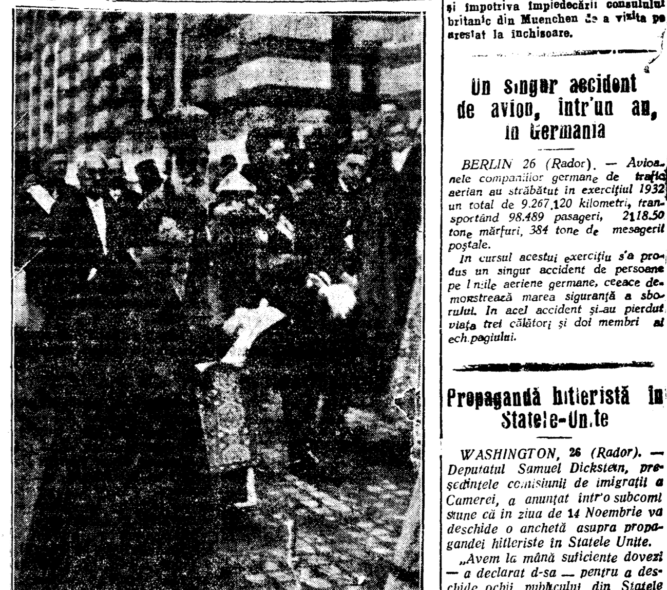
Suveranul, Principele Nicolae, Patriarhul și membrii guvernului înconjurând biserica

VARSOVIA 26. (Tel. part.). — S'a anunțat oficial, că pentru întâia oară la serbările pentru independența polonă din ziua de 12 Noembrie, va asista și o delegație numeroasă a armatei roșii.