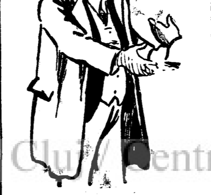
D. VIRGIL MADGEARU

Statutul român trebuie să primească pentru anul bugetar 1933-1934 plata unui acout în de-valoarea nominală. „Drepturile purtătorilor pentru sold sunt în întregime rezervate. Îndată ce guvernul român va fi în posesiunea ratificărilor acordului de către asociațiile detentorilor, sumele necesare executării acestui acord vor fi remise agenților financiari însărcinați cu plata. Regulamentul soldului va face obiectul negocierilor care se vor începe la Paris în cursul primei chenzine a lunii Ianuarie 1934. Aceste negocieri, care vor trebui să se sprijine pe constatarea experților calificați, vor avea drept-potrivă ca obiect de a determina condițiunile în care serviciul împrumuturilor să fie asigurat cu încopere de la 1 Aprilie 1934.