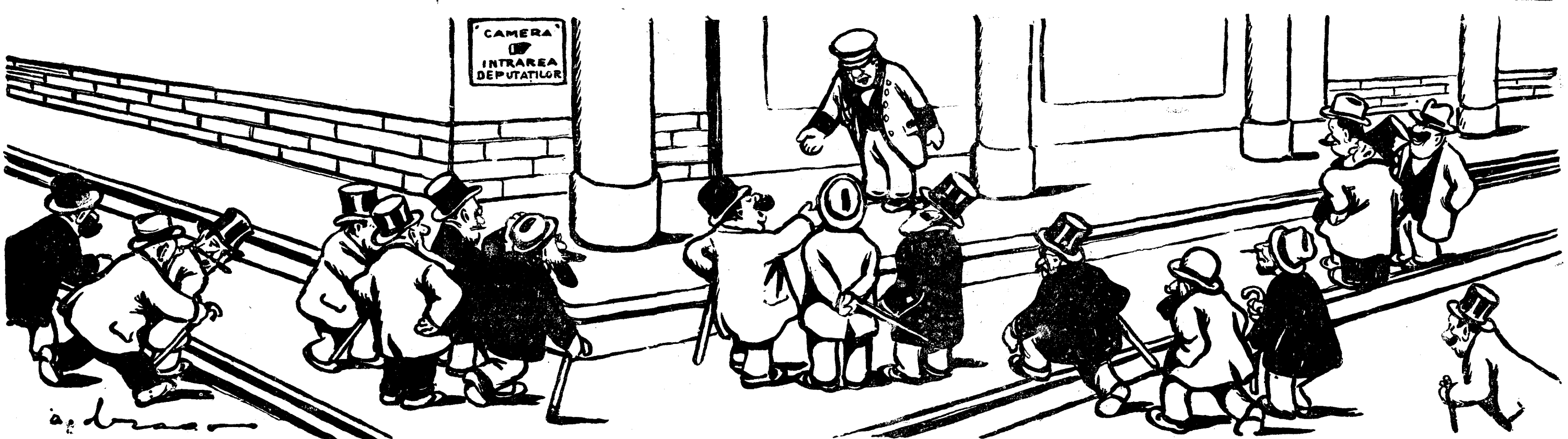
PORTARUL CAMEREI: „Păi bine, domnilor deputați, ce-ați venit astăzi? Nu știți că Parlamentul s'a prorogat până la 15 Noembrie?” — DEPUTAȚII: „Așa? N'am știut. Dar fiindcă tot am venit până aici, n'am putea face câteva voturi? Că tot se îngrămădesc prea pe urmă...”