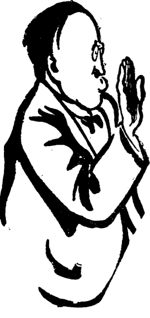
D. VIRGIL MADGEARU

Am anunțat acum câțiva timp că organizația național-jărnănescă Capitală, de sub președinția d-lui V. Madgearu, hotărâse să se facă alegeri pentru consiliul comunal al sectorului II Negru, condus actualmente de o comisie interimară în frunte cu d. Al. R. Protopopescu, deputat. Data alegerilor fusese chiar fixată pentru 10 Sept. a. c. pentru a nu se lăsa astfel răgaz opoziției de a începe o serioasă luptă electorală.