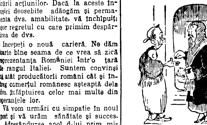
Tine, măicuță... Să fie de sufletul dora dela telefoane, trăzni-lar Maica Precistă!