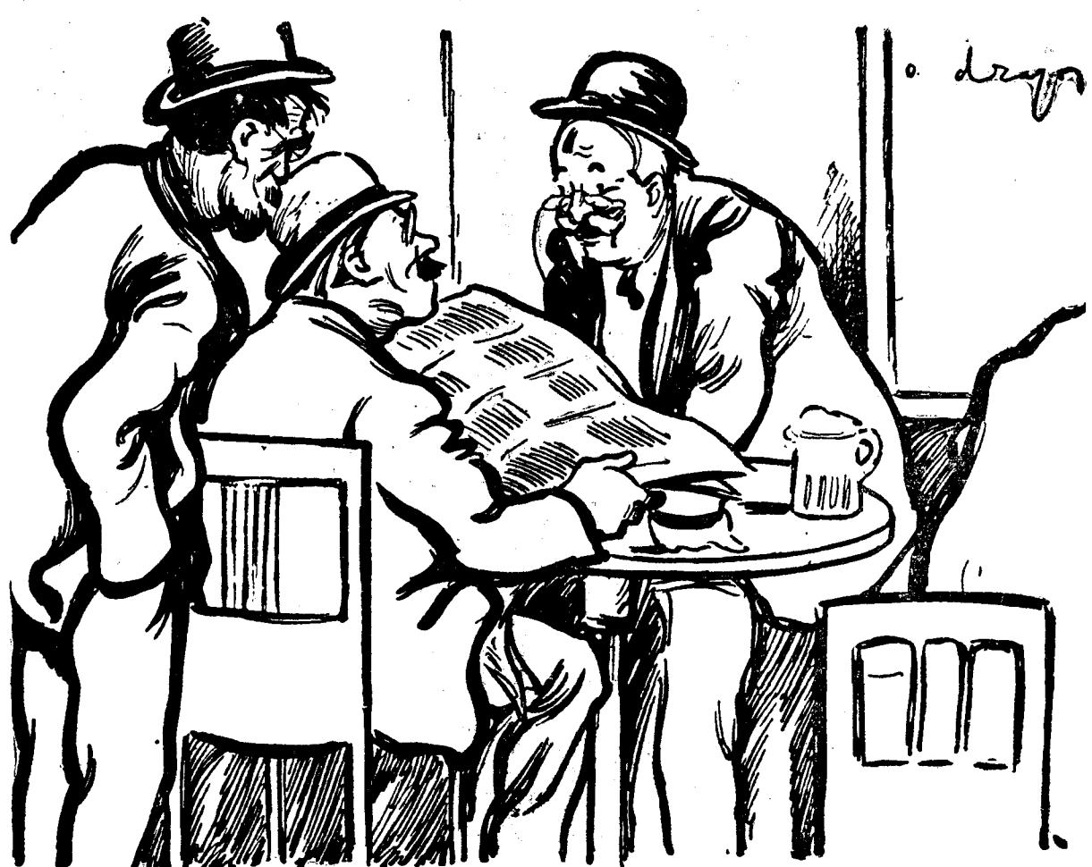
— Ce-i asta, domnule? Imi datorezi zece mii de lei și-mi dai numai un pol? — Lasa, nene, nu te supăra. Asta-i plată „simbolică”. Nu vezi că și Anglia tot așa plătește?