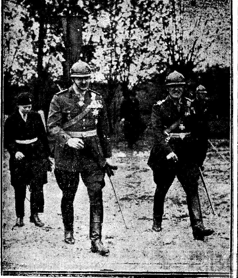
M. S. REGELE ȘI VOEVODUL MIHAI ÎNDRĂPTĂNDU-SE SPRE POLIGONUL DE TRAGERE

Timpul plios a determinat reorganizarea programului proiectat, cel sportiv militar și aplicațiile în timp, fiind remise.