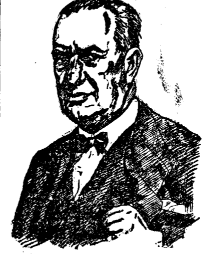
D. C. ARGETOIANU