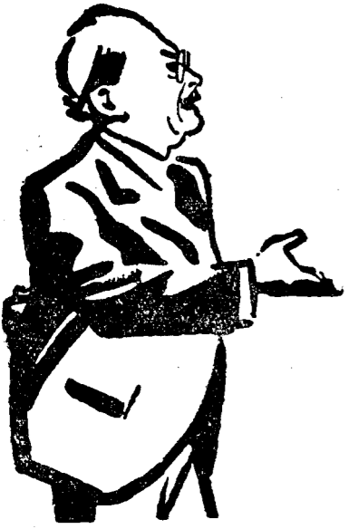
D. I. G. DUCA

Raportorii desemnați vă vor expune cu deamănuntul diferitele chestiuni cari fac obiectul dezbaterilor