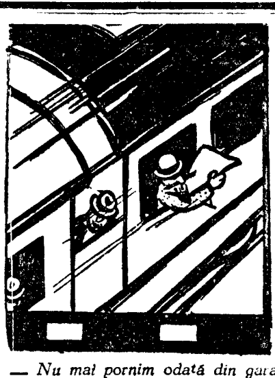
Nu mai porni odată din gura asta?... De ce întârzie atât cu plecarea?... Mi se pare că șef al gării este și aici tot un nepot de-al domnului Maniu!