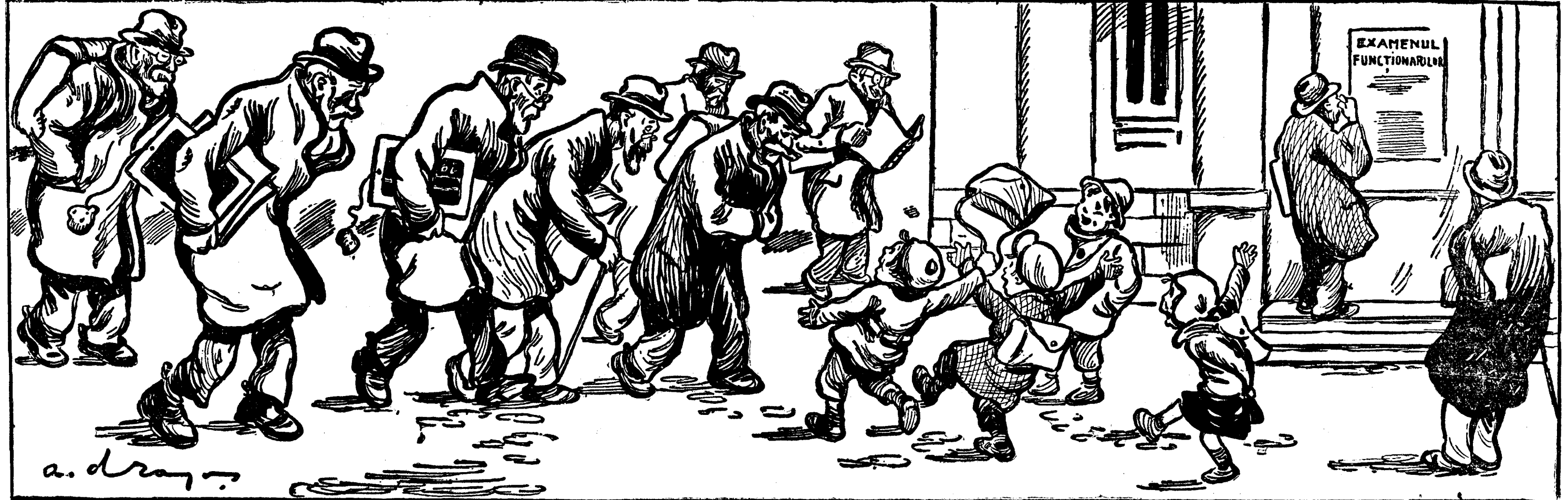
„Succes, bunicule, succes! Vezi să nu te fâștăcești...”