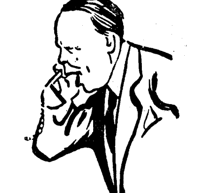
D. N. TITULESCU