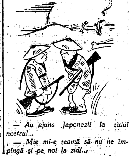
Au ajuns Japonezii la zidul nostru... Mie-mi-e teamă să nu ne împingă și pe noi la zid...