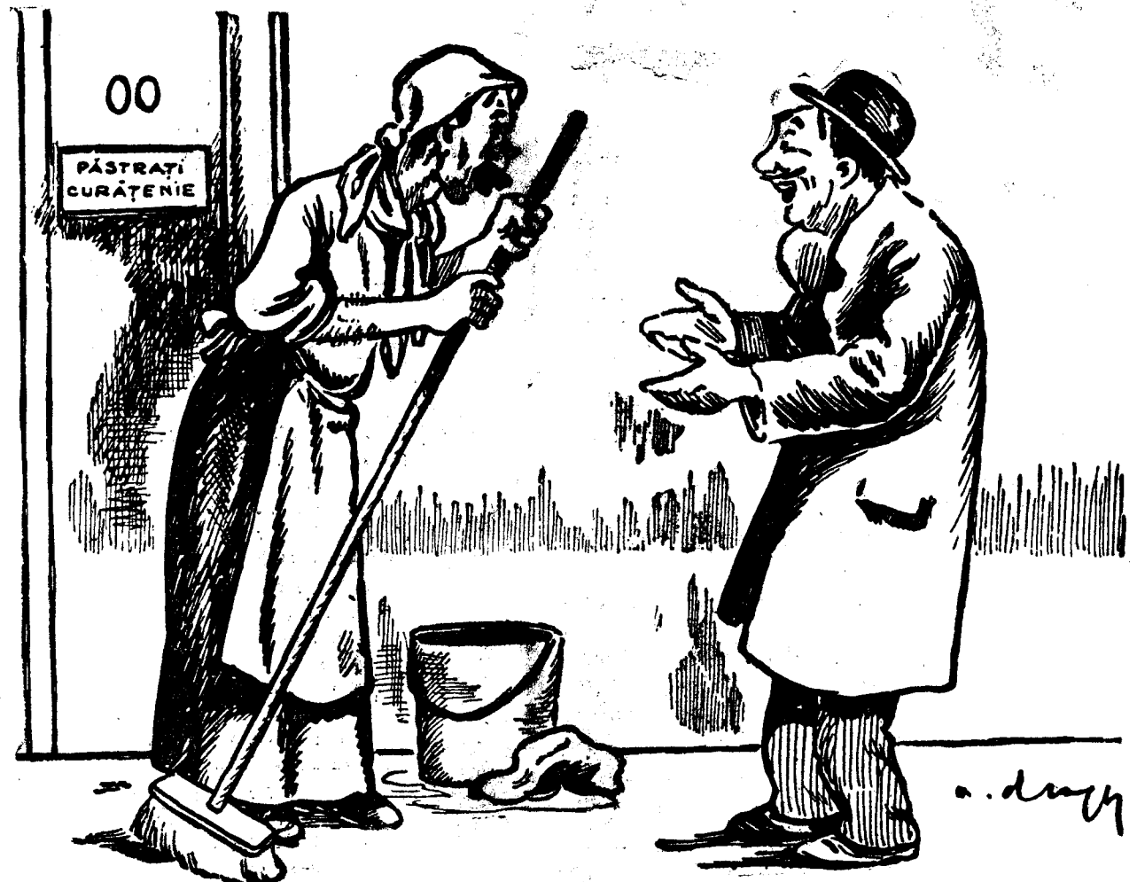
— Ce-i halul ăsta pe tine, bre? — Ce să fie, dragă? Ceasul rău. N'am studiile cerute de legile d-lui Madgearu și din șef de birou am fost încadrat femeie de serviciu!

sais pas prévôir les malheurs de si loir”, — răspundea Pyrrhus, cîndva, într-o tragedie clasică, zămislită în veacul prevăzătorului Richelieu. Mai mult decît eventualitățile ipotetice de mâine, importă astăzi amenințările patente ale momentului prezent. Comunismul este, pentru Statul românesc actual, principala și cea mai hidoasă dintre aceste primele. Cu atît mai intolerabilă și mai copleșitoare, — cu cît această primeidie nu poate fi anulată sau atenuată prin efortul nostru izolat: problema de ansamblu a continentului, ea nu poate fi rezolvată decît prin svîcnirea solidară a compartimentelor etnice amenințate. Chiar cu o țară integral purificată de comunism, rămînem încă expuși catastrofei, dacă mistică banditismului de Stat izbîndește în vreuna din marile țări ale Europei centrale: cu un Reich inundat de comunism, coboară și țara noastră sub lespezile negre ale anarhiei. Iată pentru ce este providențial Adolf Hitler, omul care injunghie marxismul în chiar patria lui de incubațiune, în principalul său focar de prestigiu. Iată la ce este Hitler bun. Bun și salubru, — binevenit și demn de aclamațiuni. „Heil Hitler!” Peste precarele bariere ale democrațiilor, cari se canonează să combată comunismul cu fumigații și cu predict, — pășeste masiv chirurgul care știe că împotriva vaccinismului nu pot fi naștunile vaccinate decît cu junghii. Injunghierea comunismului, — să fie prologul demerșilor europene. Ion Dimitrescu