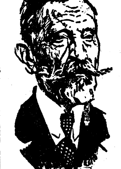
ZAIMIS Președintele republicii

În această proclamație generalul Plastiras arată că alegerile de ieri