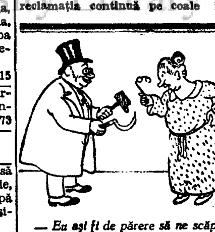
— Eu aș fi de părere să ne scăpăm și de ciocanul ăsta și de seceră...