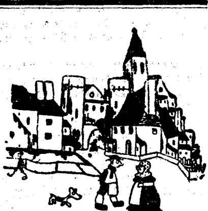
— Crei e'am făcut bine votana pe Hitler?... Mă gândesc cu frică să nu se supere democrații din România!..

Ce mai rămâne din legea de avansare a funcționarilor, când toate funcțiunile sunt ameninate a fi a caparale de acești băieși ai oficiului de studii? Dar ce să mai insistăm? Suntem mulțumiți că n'au prevăzut în lege că la cerere, băieșii oficiului de studii pot fi obligați să fie comandanți de armate, șefi de stat major, directori generali la calea ferată, la poșta, la serviciul sanitar, conducători de grădini de copii, unde se pare e nevoe să fie trimiși, dacă bine înțele ministerul de finanțe nu vrea să aibă aspectul de grădini de copii cu năsbății.