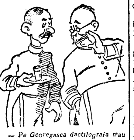
— Pe Georgescu doctoreștii n-au trecut-o'n cadrul dispozițiilor. — Te cred! Aia scământă cu te-mea-panteră!

Astăzi, la orele 9 dim., are loc în sala „Teatrului Liber” prima întrunire profesională convocată de partidul liberal. Intrunirea va fi prezdată de d. Duca și se vor avea loc atâta de dimineață cât și după amiază. În ședințele de astăzi vor fi discutate următoarele probleme: 1. Raportul d-lui Al. Allmăntescu asupra situației și nevoilor agriculturii; 2. Raportul d-lui V. I. Sabăreanu, asupra „Industrializării producătorilor agricole”; 3. Raportul d-lui C. Opran, asupra poluării forestiere; 4. Raportul d-lui I. Manolescu-Strunga, asupra pescăriei și exploatarei lor; 5. Raportul d-lui Mișu Constantinescu, asupra valorificării produselor agricole.