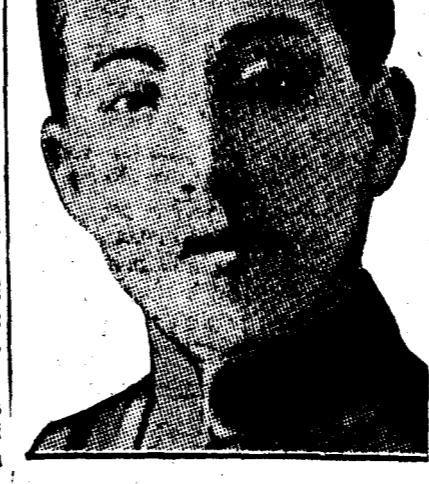
MAREȘALUL CIANG-SUE-LIANG comandantul chinez

După cum am anunțat, astăzi după amiază d. I. G. Duca va fi primit în audiență de Rege.