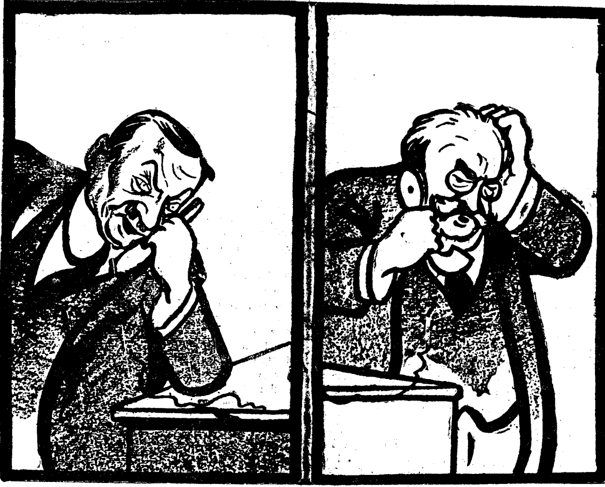
D. MANIU: Ei, cum merge Alexandru? Te susține partidul? D. VAIDA: Străniș, frate Iuliușe! Și prin Patria și prin Dreptate. Noroc că nu mai avem alt oficioș...