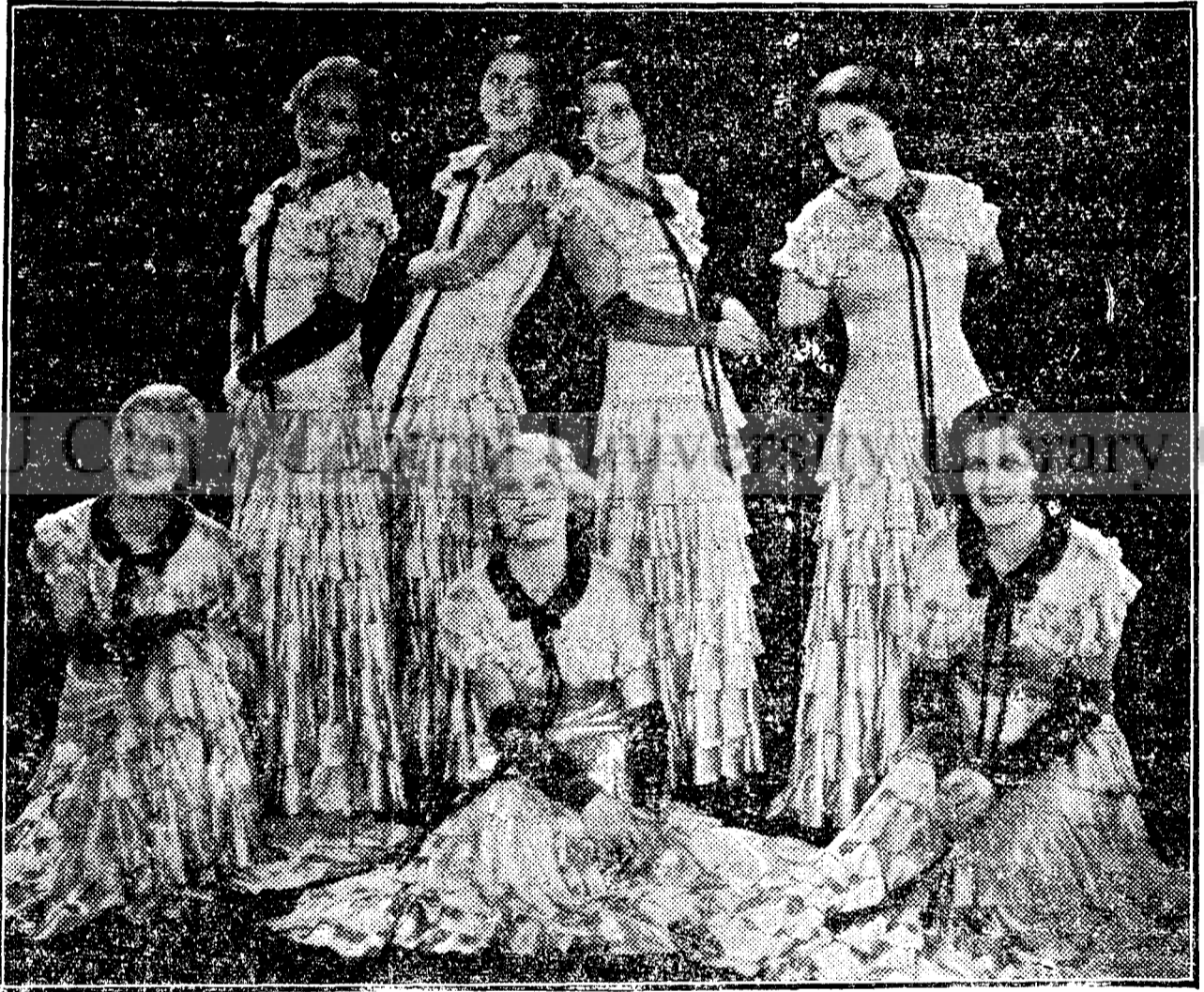
RENUMITA TRUPA „SINGING BABIES” DIN MARELE FILM „BABY” CU ANNY ONDRA, PREZENTAT DE MERCUR FILM LA CAPITOL ȘI ROXY