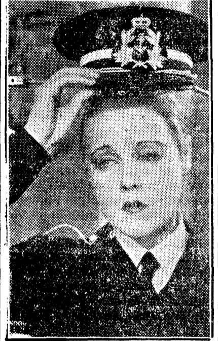
ANNY ONDRA ÎN FILMUL „BABY”

Regia o semnează admirabilul regisor Karl Lamac, nedespărțitul mentor al dragălașei Anny Ondra.