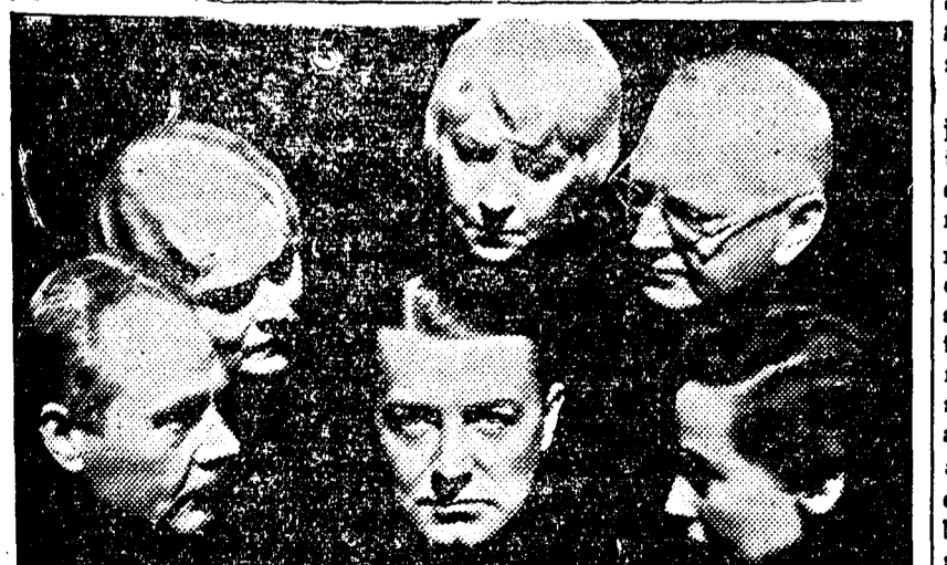
INTERPREȚII FILMULUI „NOA PTEA DE 13 IUNIE” CE SE PREZINTĂ LA CINEMATOGRAFUL SELECT

Sperăm că acest film se va bucura și la noi de aceeași primire pe care a avut-o pe ecranele străine.