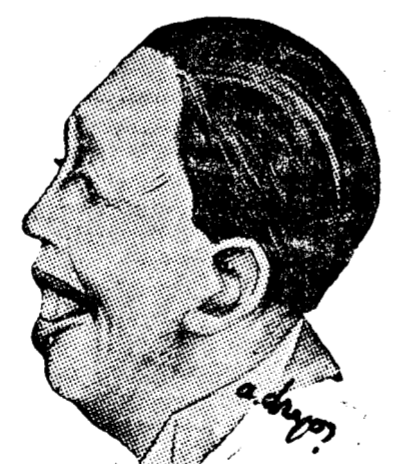
D. N. TITULESCU

Imediat au început să sbârâle telefoanele, miniștrii și subsecretarii să se îmbrace în fracuri, automobilele să se pregătească să plece în drumurile lor.