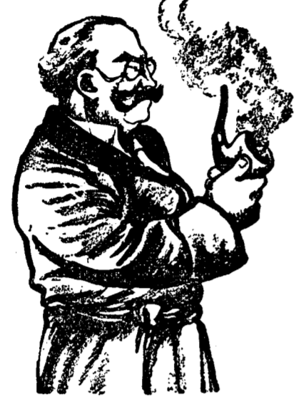
D. AL. VAIDA VOEVOD

Pe neașteptate însă, de la orele 3 jum. d. a. evenimentele au luat o tur-