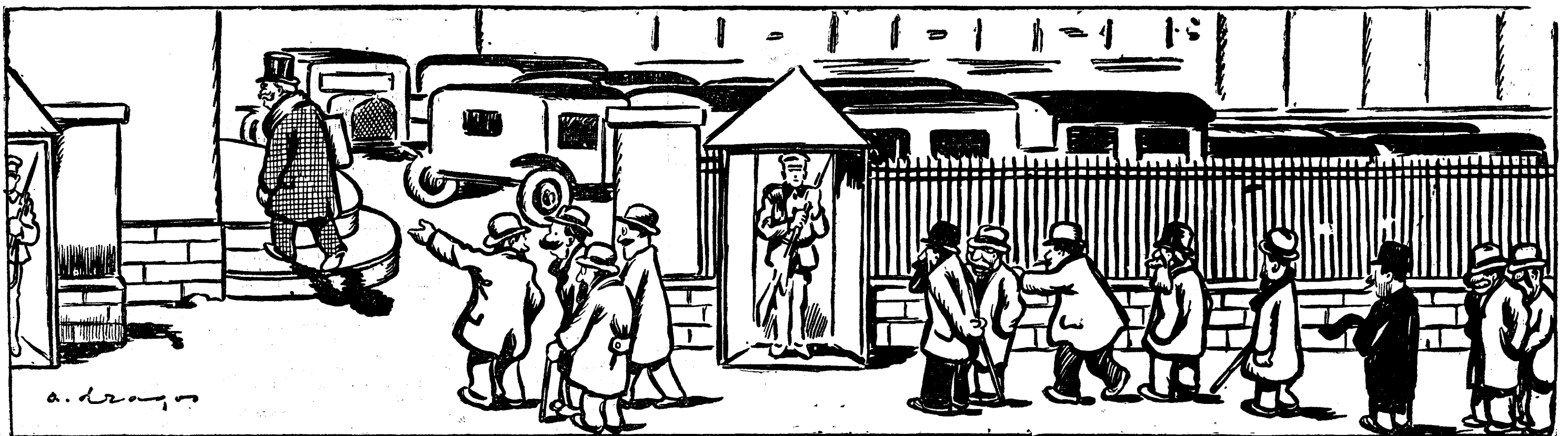
— „Vreasăzică asta e noul prim-ministru național-țărănist!” — „Fugi, domnule, de aioli E tot ăla vechiu. Și-a pus numai mustăți și ochelari...”