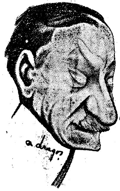
D. IULIU MANIU

exprimat dorința ca unele posturi importante să fie sustrate fluctua-țiilor politice, socotind necesară permanențarea mai ales în postu-ri de supraveghere a ordinii și siguranței publice. Astfel motivat, decretul de înlocuire a fost refu-zat. Socotindu-se deosebit de gene-ral Văitolanu a vroit să-și dea o demisie șgomotoasă; dar bunul simț al lui Al. Constantinescu a împiedicat ridicolul unei asemenea crize. Și atunci erau unele funcții ocupate de — „oamenii Regelui”; dar nici un guvern nu s'a gândit să se hărțuiească necontenit cu Regele Ferdinand pe această temă.