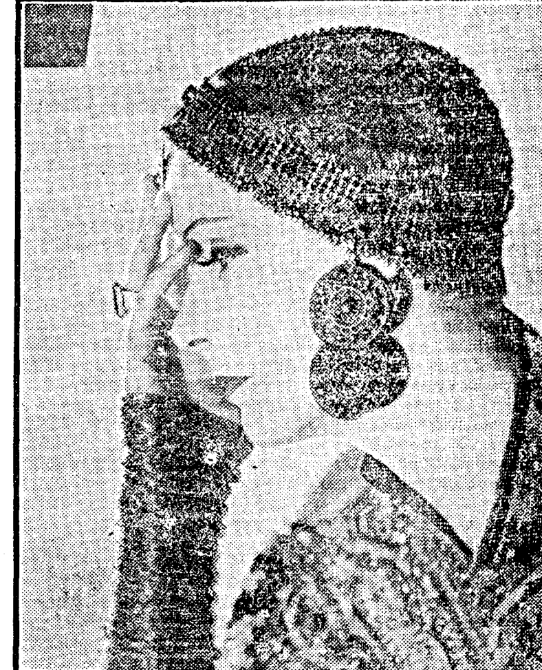
SERIALUCITĂ GRETĂ GARBO ARE O CREAȚIE MAGNIFICĂ ÎN ROLUL SPIOANEI MATA-HARI

Capitolul pregătește pentru săptămâna viitoare cea mai senzațională premieră a stagiunii: „Mata-Hari” în fastica interpretare a GAREI GARBO, cu suspiciuni, Mata-Hari își urmează viața misterioasă. Autoritățile franceze o bănușesc