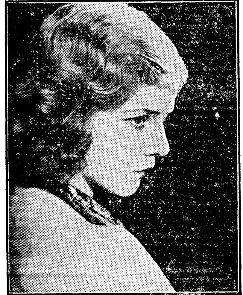
ELISSA LANDI NOUA VEDETA FOX A ECRANULUI AMERICAN

Intocmai ca și presa americană, cu prilejul premierii de la Winter Garden din New-York, presa germană aduce cele mai vii elogii filmului și realizatorilor lui.