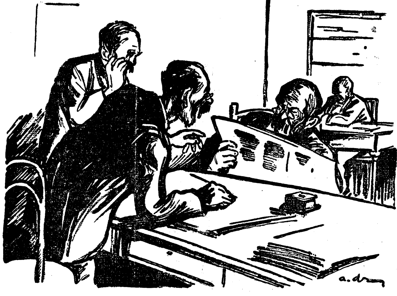
Cum, domnule? Titulescu a rămas și ministru plenipotențiar la Londra și ministru de Externe la București? Ei și? Ce-are aface? Tot la Geneva o să stea...