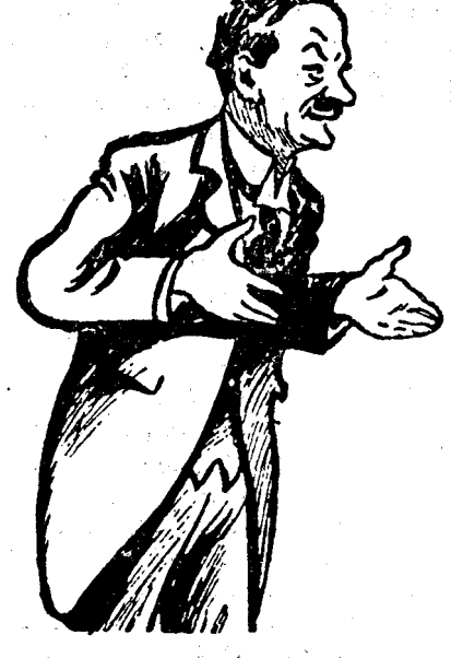
D. IULIU MANIU

În ce privește politica externă, guvernul va merge cu fermitate și fără ezitare pe căile tradiționale: respectul alianțelor și menținerea tratatelor. În ce privește U.R.S.S., suntem dispuși a avea cu ele cele mai bune raporturi și dorim sincer a încheia cu ele un pact de neagresiune. Guvernul prezidat de mine fiind acela care a ratificat la timpul său pactul Kellog și l-a prețuit atât de mult încât l-a pus în vigoare cu anticipație prin tratatul dela Moscova nu poate firește semna decât un pact de neagresiune, care să nu pună România într-o situațiune de inferioritate față de acela pe care l-a creat-o pactul Kellog.