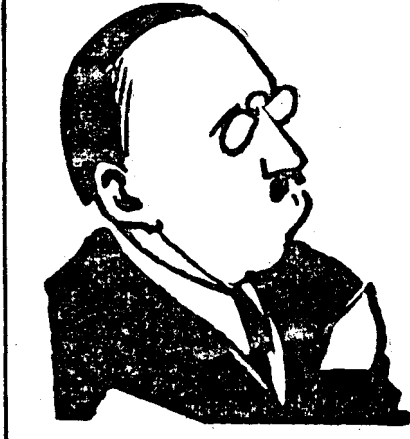
D. VIRGIL MADGEARU

„În împrejurările de azi, a început toată lumea să se gândească la soluții, și în situația de față, prin care trece țara, sarcina de ministru de finanțe reclamă o muncă intensă și istovitoare în fiecare moment. M'am supus acestei munci, cu răvnă și n'am avut încă o dihină, sperând să ajung la îndreptarea situației. Am simțit însă, nevoia de repaus. Dar în situația de astăzi, care reprezintă o muncă neîntrerupută, odihna nu înseamnă o sarcină în plus, ci o necesitate de a se putea concentra asupra problemei de finanțe și de aceea am refuzat la constituirea noului guvern, de a conduce mai departe finanțele țării. Am primit însă, ca o solidaritate față de colegii mei, o altă sarcină oscaratoare pentru mine, care să-mi permită odihna de care am nevoie.