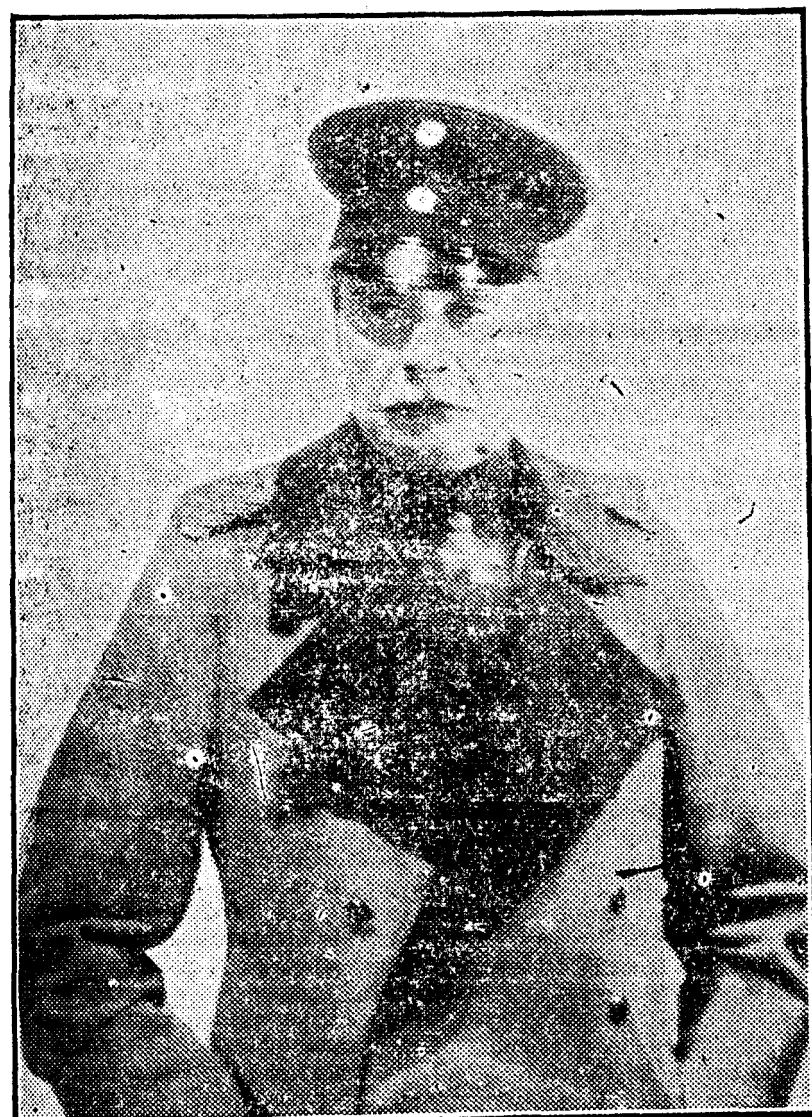
MARELE TRAGEDIAN ALBERT BASSERMANN IN „CADEȚII”

Cinematograful „Regal” prezintă după ce s-a vorbit să spună ce au în vedere de azi, mult așteptat, pentru se duse la film „Cadeții”. Este ultima creație a Maltzahn. Rudolf este ca mut, nici mare în tragedia Albert Bassermann, un cuvânt nu e din gura lui.