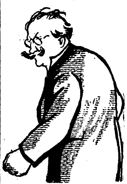
D. VAIDE VOEVOD

După cum se vede d. Valda s'a întors foarte mulțumit dela Roman. Dealtfel, cercurile apropiate primu lui ministru, afirmă în cursul nop-