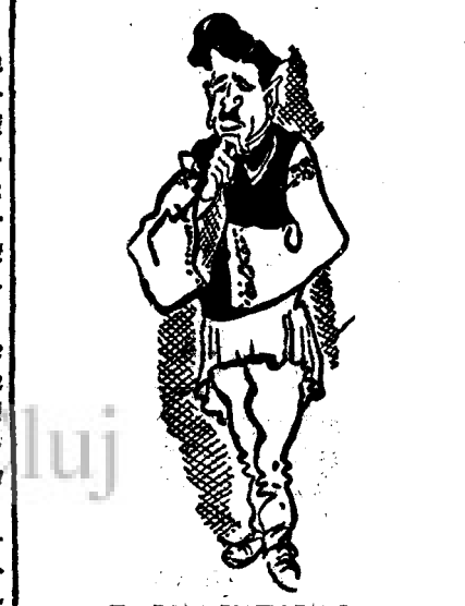
D. ION MIHALACHE

„Datoria fiecărui dintre noi era — nu să amenințăm cu excluderea, ci să ne străduim în găstirea unei formule de apropiere, care să asigure în viitor unitatea de acțiune, chiar dacă în problema de față ea nu putea stabili”.