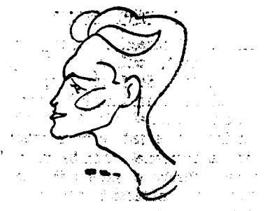
MAIOR II (Juventus)

Ministerul de instrucție a stabilit normele asupra înaltărilor corporului didactic primar.