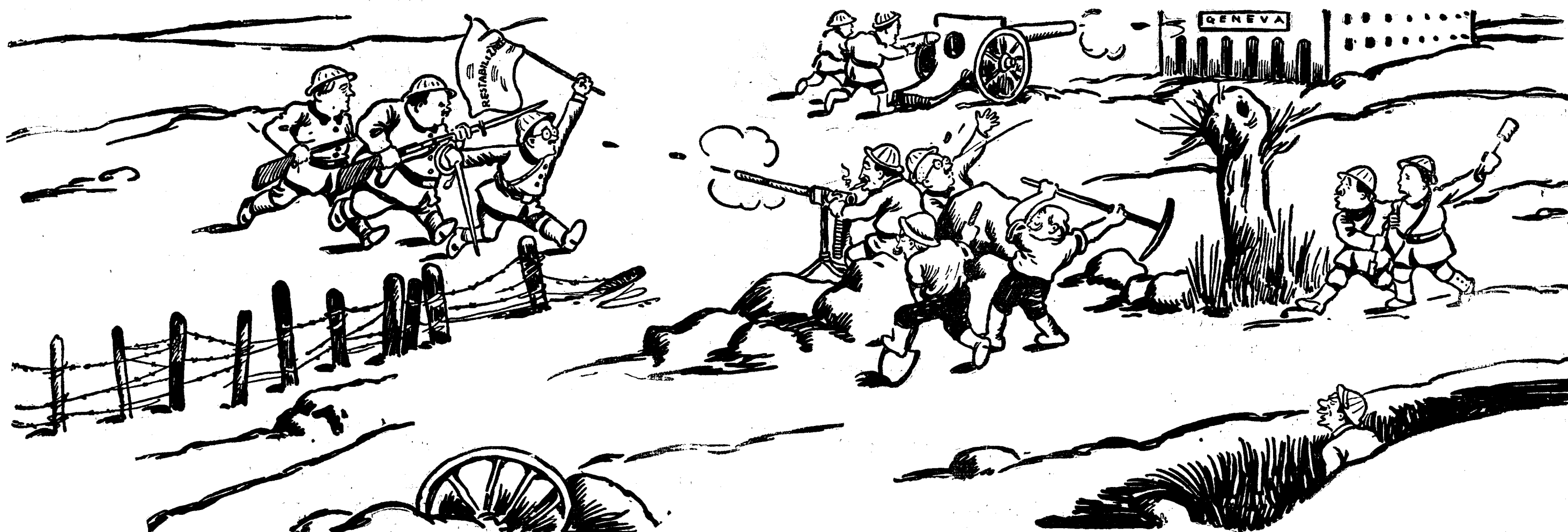
Manevrele de toamnă...