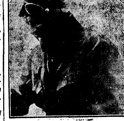
D. GEN. BALBO

VARȘOVIA, 3 (Tel. part.). — Pe litoralul lacului Wansee în stația climaterică îndepărtată de Berlin cu 7 kilometri într'un restaurant co-