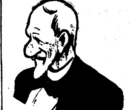
D. MAREȘAL AVERESCU

BUENOS AIRES, 3 (Radior). — Mai mulți vulcani din regiunea munților Cordillieri au intrat în erupție. Erupțiile sunt foarte puternice. O ploaie de cenușe vulcanică a căzut asupra mai multor orașe din regiunea muntoasă.