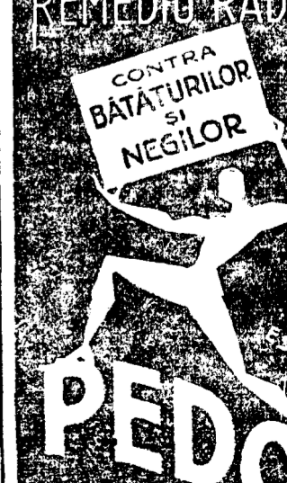
REMEDIU RADICAL CONTRA BĂTĂRIILOR ȘI NEGILOR PEDOL

„L'Auto” sosit ieri, analizează șase echipe participante la Cupa Balcanică și găsește că favorită e România.