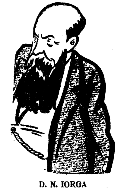
D. N. IORGA