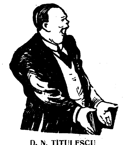
D. N. TITULESCU

Geneva 19. (Tel. part.). — Astăzi secretarul de stat al Statelor Unite Stimson a vizitat sedința conferinței de dezarmare... STIMSON LA SEDINȚA CONFERINȚEI