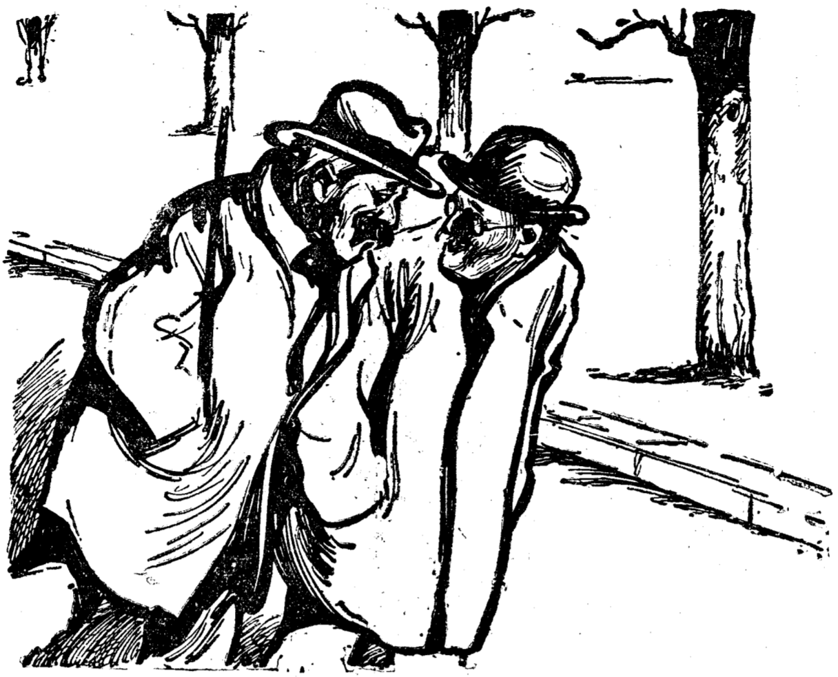
Ai văzut că Chinezii nu mai vor să se bată cu Japonezii? Am văzut! Mare noroc are și Liga Națiunilor asta...