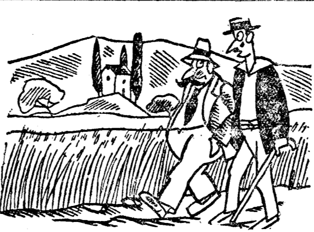
— Și când ai dat-o afară, vrajtoarea ce-a răspuns? — A început să mă blesteme. Zice: Să dea Dumnezeu să n'ai ce mânca, să nu se țină sărănițele de tine, să-ți moară copiii de foame, să ajungă de mila lumii... și încă mai rău. S'ajungi invățător, nu!

tre elevi se sculă și zise: „Ah, domnule, pentru ce ai rupt linia? Cu ce vom mai arăta noi la harță?” Muștră d-lui subrevizor nu v'o mai descuri. Lipsa aceasta de tact și de demnitate, se înțelege nu se poate impune tuturor celor cu concurs — licențiați și nelicențiați — dar s'au strecurat printre ei și din cel care nu merita și au parvenit și unii care n'au la bază decât 4 clase de școală profesională.