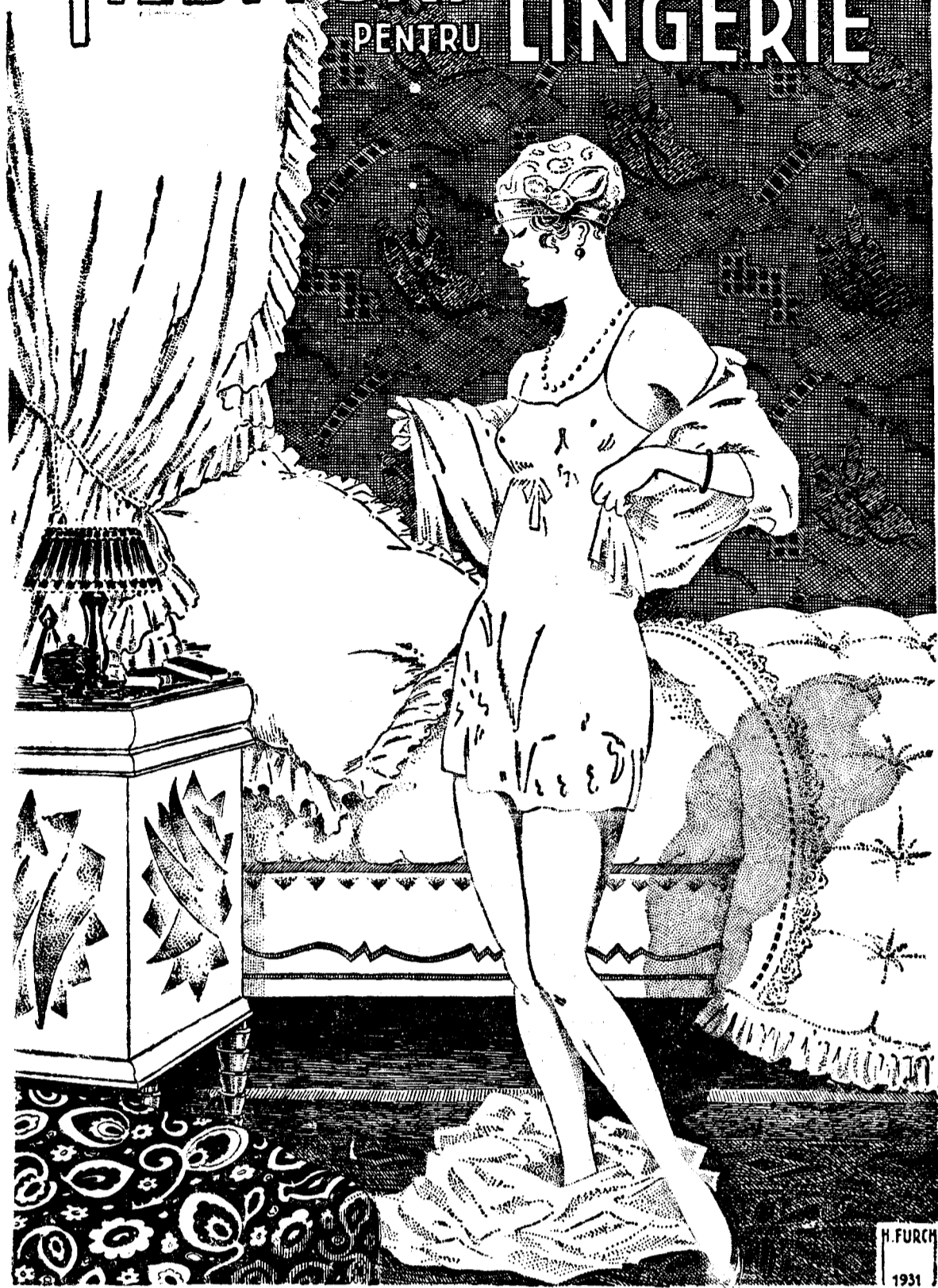
LA VULTURUL DE MARE CU PEȘTELE IN GHIARE

Theodor Atanasiu & Co. STR. BAZACA 1-3 STR. CAROL 76-78-80 STR. HALELOR 21