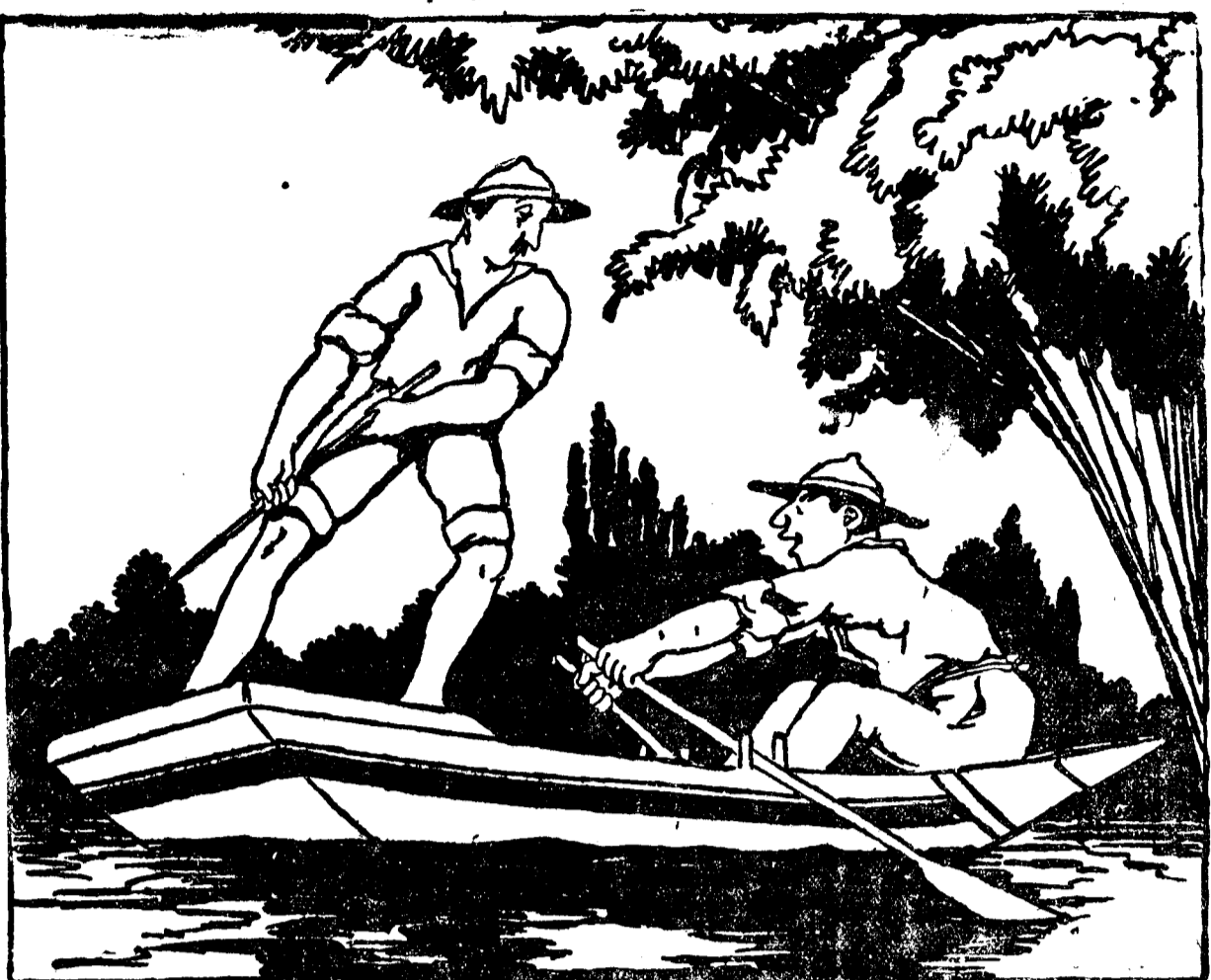
Ai auzit?... Avem de-acum dreptul să ne pescuim crâţile şi asternturile din fundul apelor, fără să mai plătim nici o dijă... fiseului!... Adică crezi tu c'o să admittă Statul să socotească şi gospodăriile noastre în „pescuitul mare”?...