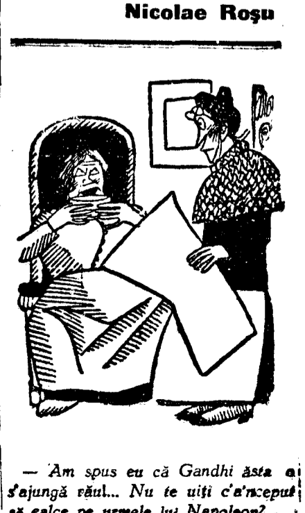
Am spus eu că Gandhi asta e! S'ajungă răul... Nu te uita c'atnceput să calce pe urmele lui Napoleon!

Comentate de D. Murăraşu. Ed. Scrisul Românesc. Piaţa literară şi publicistică periodică este invadată de un tsunami de valori incandescente, proclamate cu vigoarea adolescenţei. Tineri de provenienţă incertă şi cultură superficială, într'un delir de personalism excesiv năzuiesc să afirmepdoaba vremelnică a unui talent ingeniuu călăt la flacăra entuziasmului juvenil.