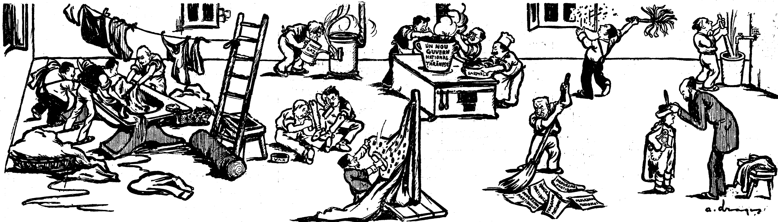
Anticipări politice. — Viitorul guvern de „gospodari” la lucru