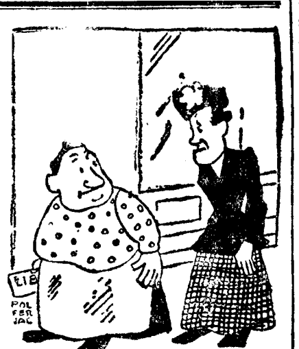
— Aoleo, coană Săftico, ce și-ai pus pâlăria aia așa pe ceață? Par'că ești scăpată din cutremurul ăla din Noua Zelandă!...