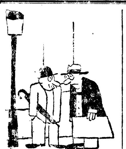
— Știau eu că, în cele din urmă, tot trebuiau să se ieftinească!... — Cum?... S'au ieftinit lemnele? — Nul... Ventilatoarele!