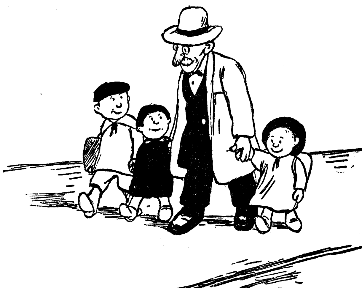
— Tătiule, tot n'avem noi foc acasă!... Hai s'o luăm pe calea Griței, că pe-acolo toți trecătorii se aleg cu focuri!...

Moscova, 30 Martie Un inginer din Pittsburg, care reprezintă aici o fabrică americană, m'a dus ieri seară într'un local de noapte: cârciumă, cafenea și tripod. Bei, fumezi, te plictisești ca peste tot. Din când în când se repede de sub o cortină roșie sau galbenă, o femeie strigată, prost fardată și prost îmbrăcată, care schinguește o canțonă. Sau un avorton care a crescut de sex vârbătesc, cu pantalon galben, vestă violetă și haină stacojie — ceva între piață neangajată, oficioasă cu mania betiei și poet revoluționar; — acesta urlă câteva injurături în versuri libere, insolite de aplauzele distrase ale indigenilor. În total un balamuc slăbitor. Din fericire veni să se așeze la masa noastră, după miezul nopții un prieten al tovarășului meu: un tânăr rus, care văzuse jumătate din lume, vorbea trei sau patru limbi, fusese balerin, actor, scenograf, critic, scriitor dramatic și