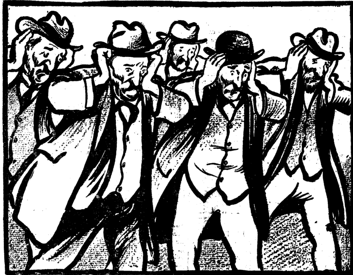
GIURGIUVENII: Bine că n'au venit și personalitățile, fraților, că ne topeam de tot...

Duminică la Giurgiu, au fost intruniri guvernamentale. Oberall, georgiștii, averescanți și gruparea „Omul Liber”.