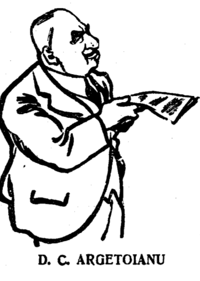
D. C. ARGETOIANU