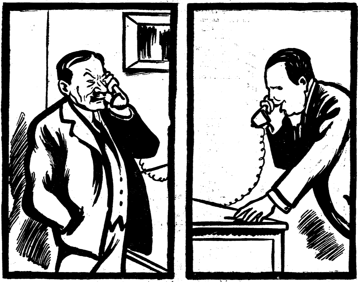
D. MANIU: D-le Titulescu, și-am trimis o delegație să te roage ca să primești șefia național-tărănistă. Ascultă-mă pe mine, nu te băga. Ce-ți trebuie bucluc?