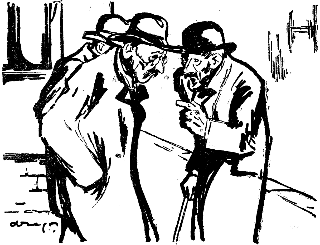
— Crezi că au să țină mult validările, la Cameră?... — Depinde de câți deputați au rămas valizi din încoterările dela alegeri...