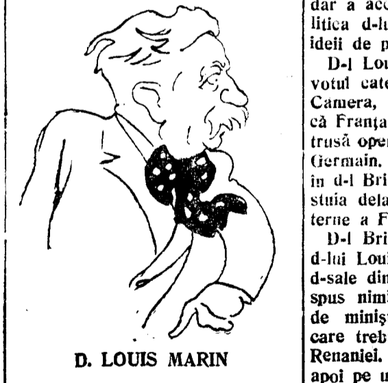
D. LOUIS MARIN

Nimic mai ridicol, — observă d. Briand, în continuare d. Briand subliniază că Franța nu e singură. Alături de ea se află nu numai Mica Înțelegeră, ci și multe alte popoare. „Disponem azi de mijloace pentru a garanta reia păcii, suntem inconjurăți de prietenii noștri. Voiți oare a rupe relațiile? Poporul german să redevină inamic? Aceasta e un viitor frumos. Dacă aceasta este atmosfera de siguranță în care tre-