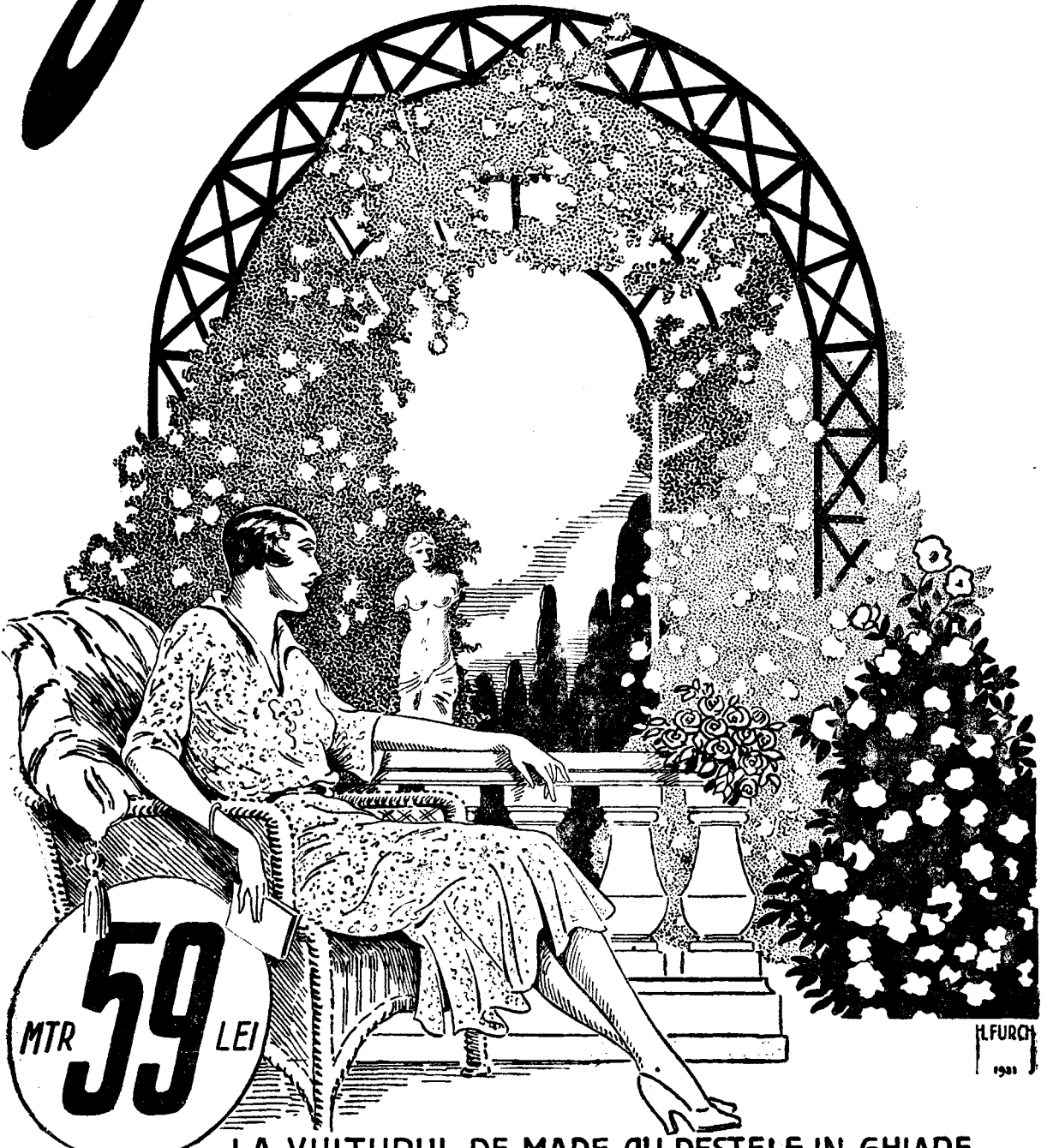
LA VULTURUL DE MARE CU PESTELE IN GIARE

Theodor Atanasiu & Co. STR. BAZACA 1 STR. CAROL 76-78-80 STR. HALELOR 21