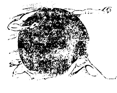
Cereți azi No. 198 din

Ca un început de realizare a programului de economii prin restrângerea numărului funcționarilor, dela președinția de consiliu au fost concediați 30 de funcționari.