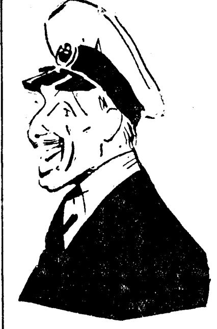
REGELE ALFONS XIII