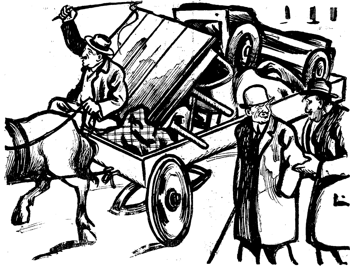
— Și unde vă mutați acum, de Sf. Gheorghe, d-le Maniu? — Nu știm încă, dragule. Suntem și noi, ca toată lumea, în... expectativă!