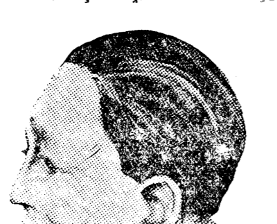
D. N. TITULESCU...