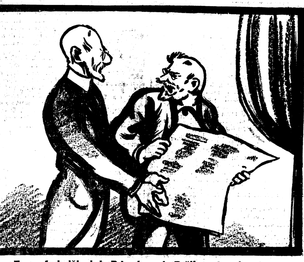
— Eu am fost alături de D-ța, domnule Brătianu, la aniversarea nenorocirii de-acum un an... Sper să te găsească alături de mine, la comemorarea mea din Iunie!..