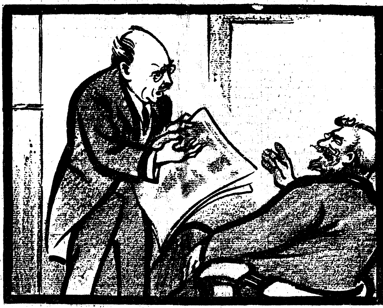
— Ne-a luat dracu, șefule, au încheiat impru mutul. — Ce te sperii! Parcă eu nu l'am încheiat de cîteva ori!

Pamfil Șeicaru avea dreptate: slujim o profesie care face în cadrul tristei noastre societăți naționale, o carieră de eroism intelectual și sufleteș. E „ordnul gazetarilor”. Dem. Theodorescu