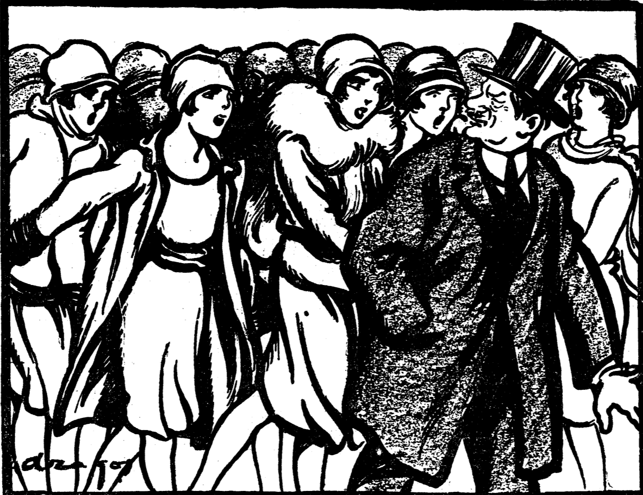
D. MANIU (prigonit de corul diurnistelor eliminate din ministere). — Astea sunt în stare să mă facă să pierd puter ca!..