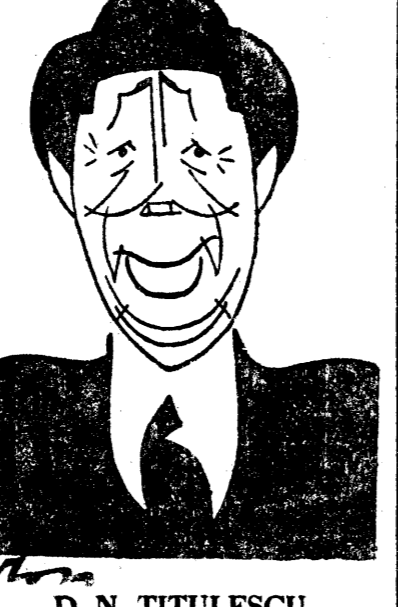
D. N. TITULESCU

E lucru știut că un important rol joacă în sfera politică, boala diplomatică picată la momentul oportun. Iarși e lucru știut că în orice organism sau grupare în politică „lucrăturile” prietenilor sunt de multe ori mai periculoase decât atacurile adversarilor, oricât de vehemente ar fi ele.