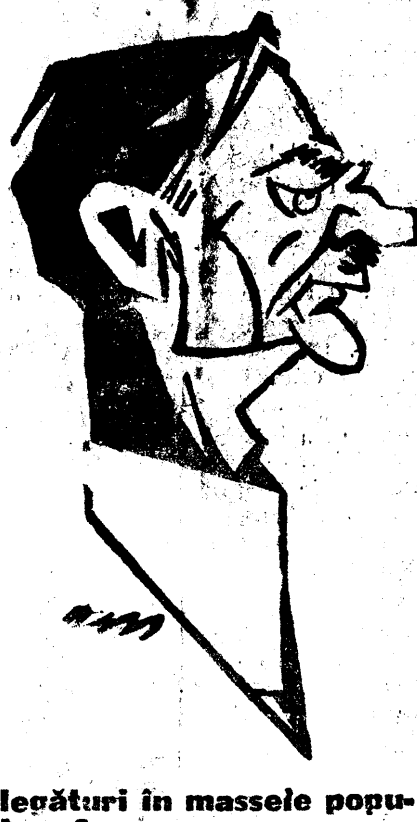
Lepturi în masele populare?

mai putea începe experiența unor guverne fără