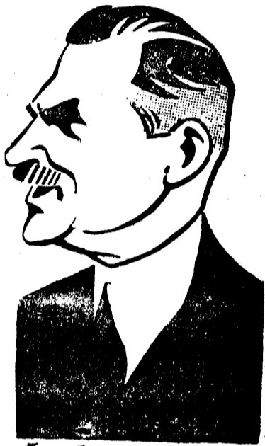
D. BARBU STIRBEY

„Combinația unui guvern prezidat de principele Barbu Știrbey nu este decât o nouă cursă ce ni s'a