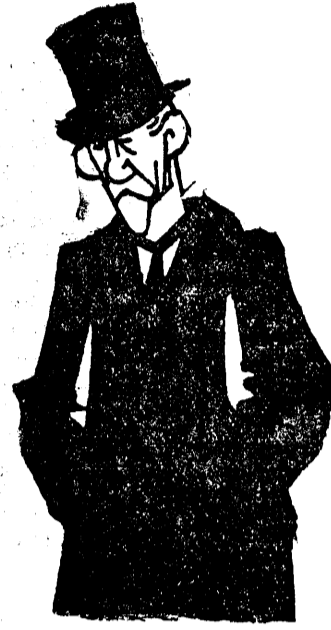
D. GEN AVERESCU

In ce privește soluția la care se va opri pentru rezolvirea crizei, deasupra