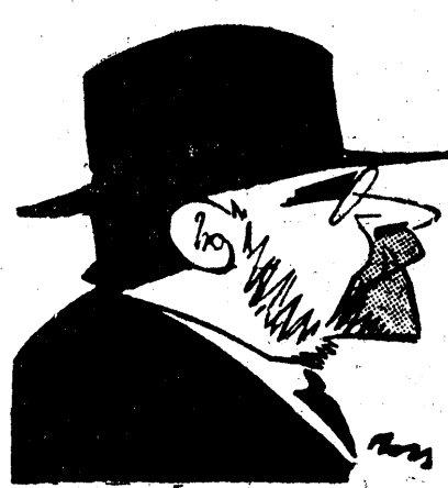
D. VINTILĂ BRĂȚIANU