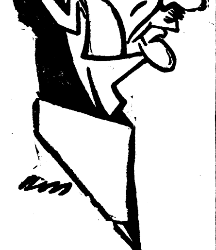
D. IULIU MANIU