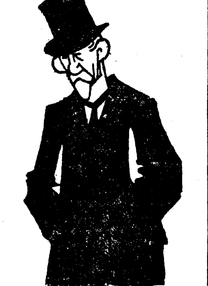
D. GEN. AVERESCU