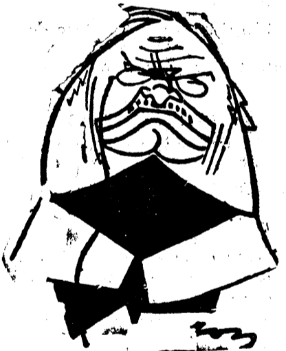
D. ST. CICIO POP

Dar astăzi ca și la 1918 jertfa nevinovată a unui popor, va aduce dreptatea pe care o jinduește de atât amar de vreme.