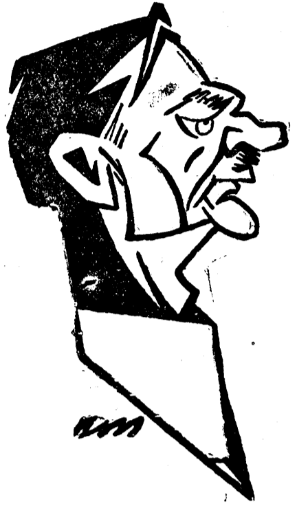
D. IULIU MANIU