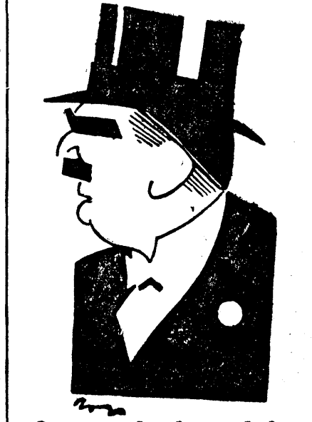
Sau, poate, tocmai de-aia?

gice, în care e cointeresată finanța liberală.