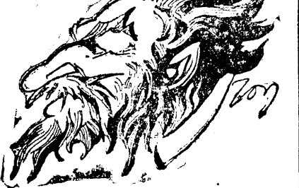
D. VINTILĂ BRĂTIANU

Acei cari au interes să se realizeze această combinațiune care este cu totul în paguba Statului, în morții ca proiectul comercializării să fie trecut în chiar sesiunea extra-ordinară a Parlamentului, din Iulie.