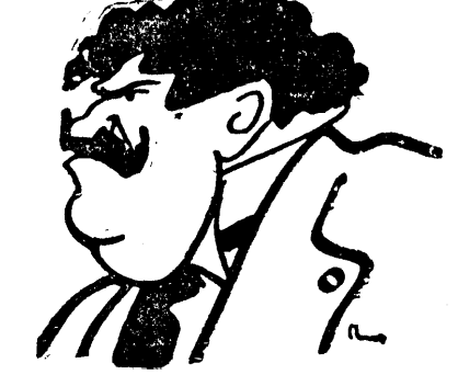
D. GENERAL MOȘOIU

Paris, 13 (Rador). — La Buenos Aires s'au produs ieri două noi atentate antifasciste. O bombă a explodat la locuința funcționarului Michelin, dela consulatul italian. Explosia a provocat stricăciuni mari. O altă bombă a explodat la locuința fruntașului fasciist Borocho, fără însă a răni pe cineva.