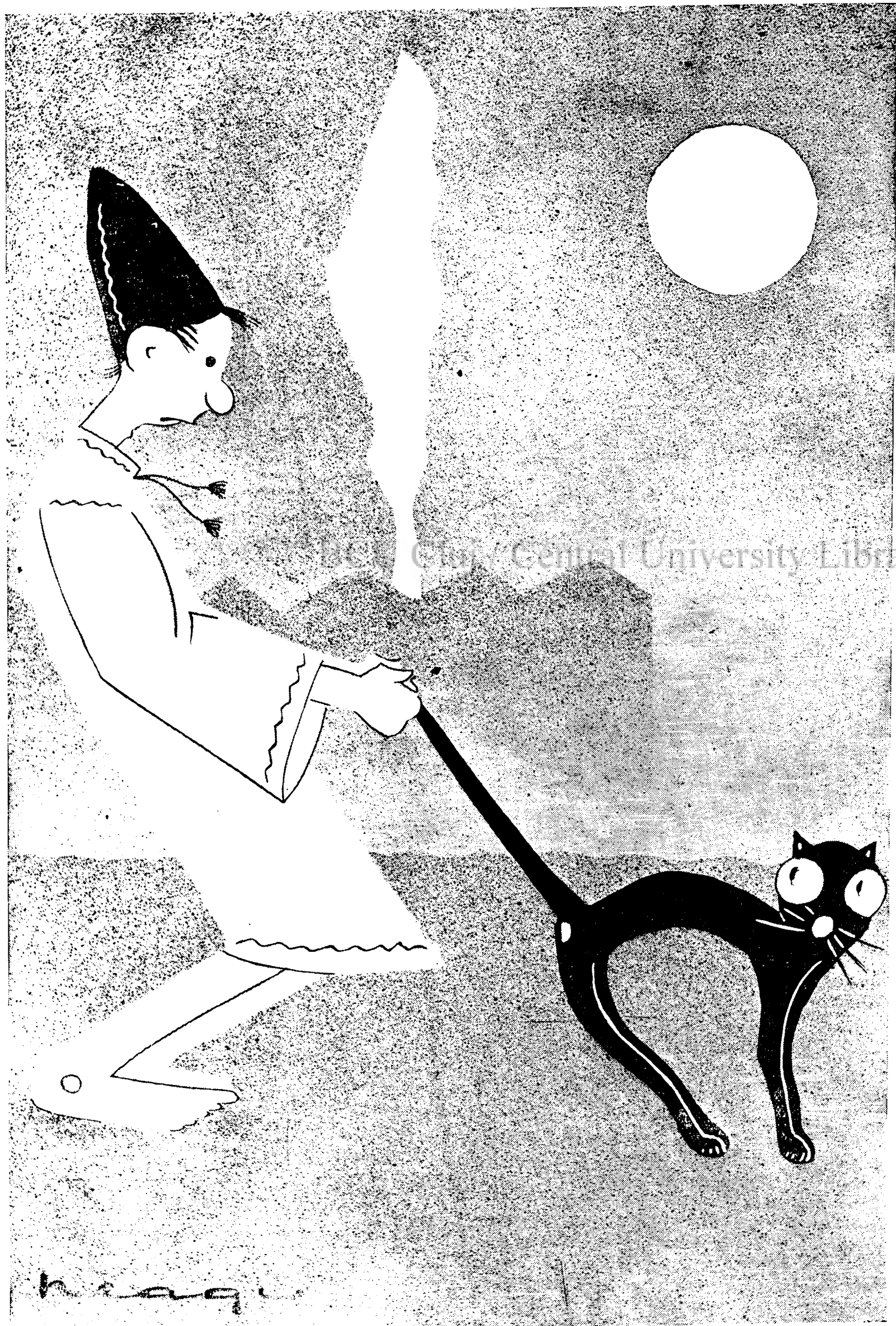
Românul de ieri, de azi și de totdeauna...