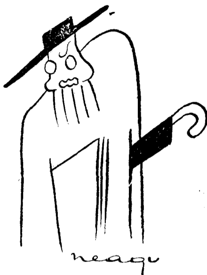
D-L NICOLAE IORGA

Până nu se va curma cu speculația intereselor individuale, până nuse va pune stavilă lucrărilor