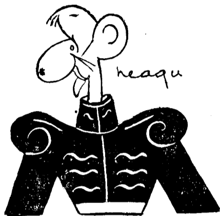
D-L MAREȘAL AVERESCU

Primul fapt este reînnoirea acordului dintre mareșalul Averescu și D-l Gh. Brătianu.