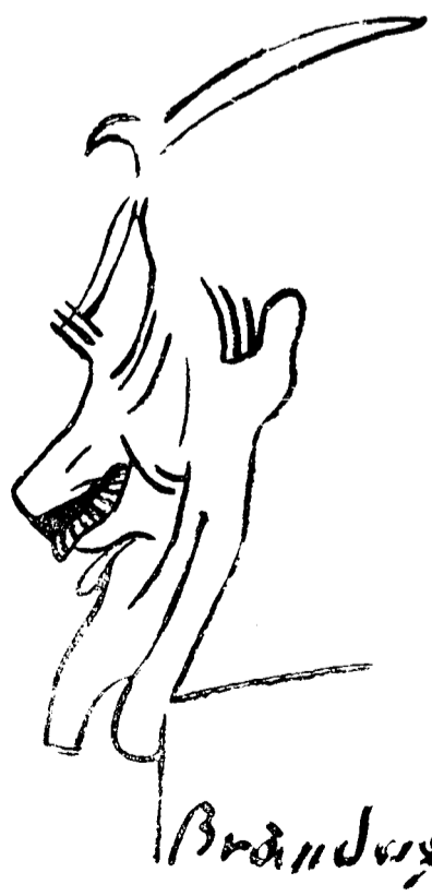
D-L IULIU MANIU

mânt. Incordarea nervilor unui popor, sărac astăzi, nedumerit mințit și momit, atunci când își va da drumul ar împoșca lava fierbinte a revendicărilor lui în toate direcțiile. Deci și bine și