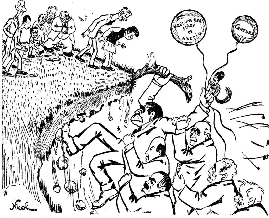
Inculeț & Comp.: Ține sfoara bine șefule, că dacă scăpăm baloanele ne-am dus dracului...