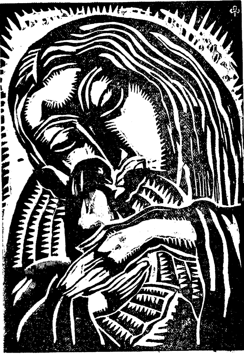
MAC Fecloara cu Colomba

UZINA În subsolul tău am crescut ca o larvă; Sirenă ta, de fiecare zi, Îmi elatină pașii de frunză bolnavă. Te simt în pulsul înghețat al mării În febra buzelor pătate de cadavrul pării. O, când văd că de toată truda mea Nu s'a ales nimic, Că toată viața n'am slujit Decât pentru mâncare, Când alții din nimic ridică Vărfuri de castele p'na la soare, Rămân năno... Și nu știu ce-am, Că'n inima pe care azi o drămu Ceva neînțeles, mă roade și mă doare. Vită îmbrăncită spre robia muncii, Mă arde în palmă uleiul conductelor Mă doare auzul de răgetul lunii. Treaz... Vedenia mea ești tu uzină, La Dumnezeeul tău care mă plătește Și-mi ucide toate sărbătorile Zilele mele se'achină... O, ce departe a înnoptat, Umbra pădurilor cât munții Rece ca un prosp ud împrejurul frunții!... Ce mult regret Aurul grăului bătut cu copitele Și părțile casei, Și firele de porumb răsărite în primăvară, Și vadul apei Unde amurgul își adapă vitele. Spre acele locuri Unde mi-am lăsat credința să ardă Aș vrea să mă reîntorc, prin uzină, Ca o vită impunșă, din cireadă. EMIL VORA