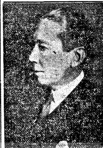
DR. N. TITULESCU