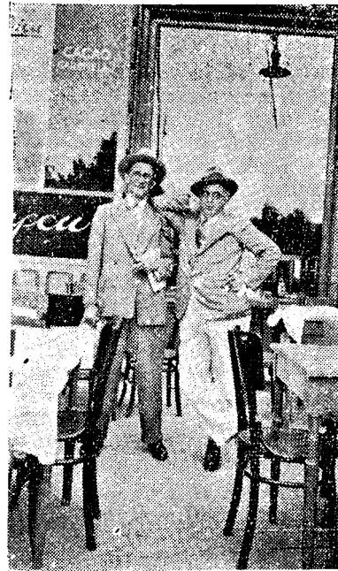
PANAIT ISTRATI ȘI DEJOUNG

Sunt fiu de țaran și am să mă duc de sfintele sărbători în satul meu dela munte. Am să spun tatei care citește aproape regulat ziarul dv.: tată nu mai citi Universul căci în capul acestui ziar este cramponată in-