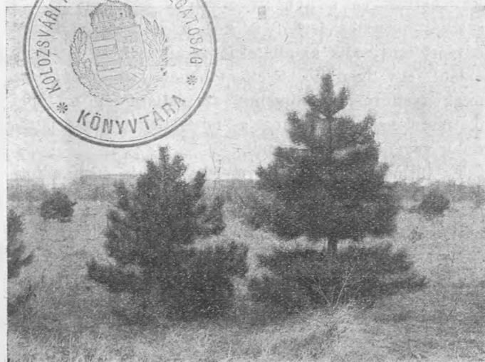
Műtrágyázási kísérlet fenyővel.

Hihetetlen eredménynyel alkalmazzák néhol a műtrágyázást a karácsonyfául szolgáló fenyőfákak termesítésénél is. Az ilyen ültetvényeken június, vagy július havában egy-egy fára 20 gramm chilisalétromot számítva, szórnak. A műveletet gyermekek is végezhetik, olyformán, hogy a műtrágyát szűk körben a törzs körül szórják el ott, a hol már némi csapadék éri a ta-