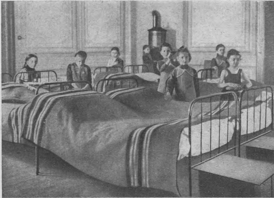
3. Egyik hálószoba.

A folyamodványhoz a következő melléletek csatolandók: a gyermeknek a) születési bizonyítványa;