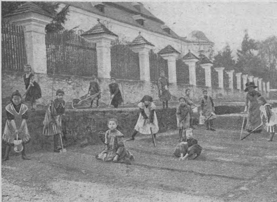
5. Az internátus kertje.

szükség esetén évközben is — leszámol a szülővel. Az iskolába való beiratási díj személyenként 50 fill., a mely a bemutatáskor az intézeti igazgatóságnál fizetendő le.