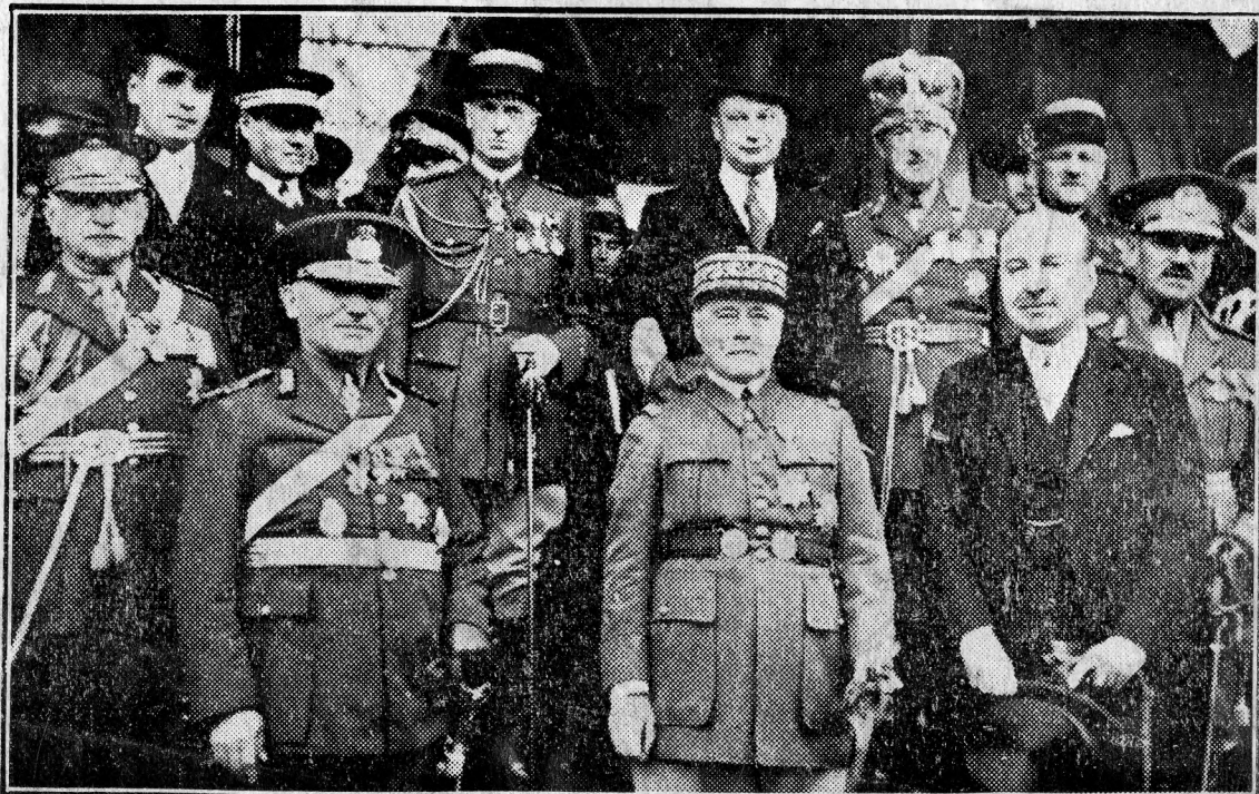
D. General Gamelin, șeful Marelui Stat Major al Franței, cu prilejul vizitei sale în România.