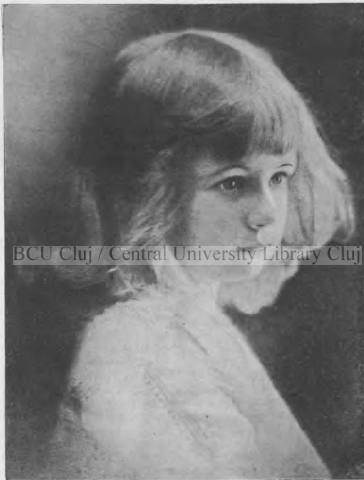
Copila cu ochi albaștri

Auzind de atâtea suferințe, Ileana, mică așa cum era, a vrut să-și dea și ea obolul, și a început să colinde pe străzi cu un coș plin de pâine pe care îl