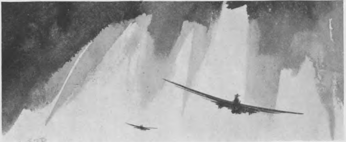
Desen de Ștefan Popescu