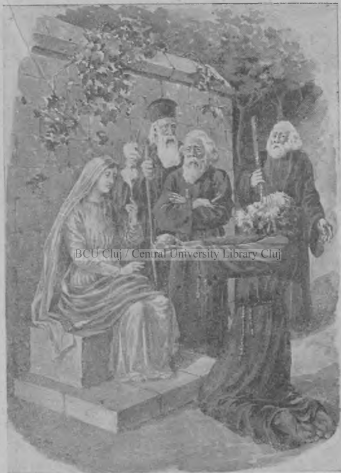
1. Asina fuzul. Sfanta Maria intinse mana sa ia darul ce i-l aducea vustnicul.