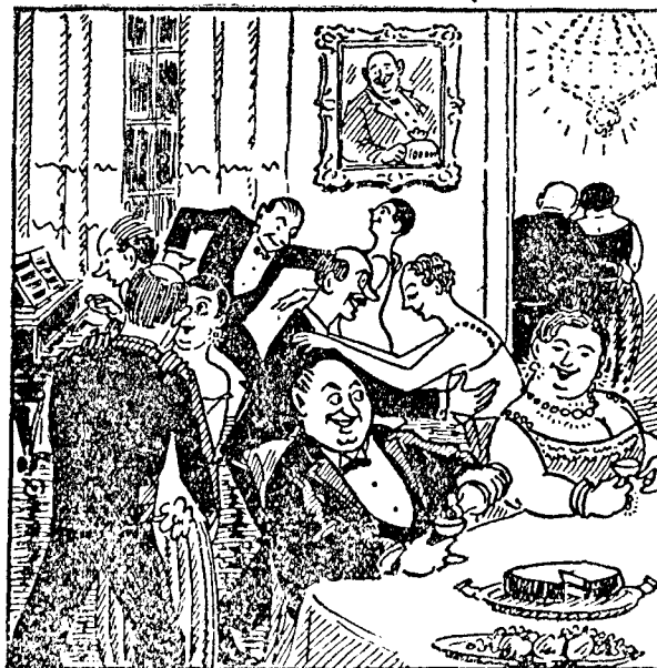
Fényben uszó meleg szobákban, Pezsgős asztal s vig dárdó mellett Téli esték unalmas nagyon könnyen telnek Azoknak, kik munkát csak könyvből ismernek,

Elképzelhetjük, hogy az ilyen soknyelvű sajtónak a kiadása mennyi fáradságot, tehetőséget és felelősséget követel. Egyes újságaink történelme nem egyéb, mint folytonos fáradság és áldozatkészség. Lapjaink bő tartalma és terjedelme bizonyítékot nyújt a szerkesztők tehetségéről. Ők, a hajdani gyári munkások, nagy szorgalommal és buzgósággal, nagyon gyakran ingyenes túlórákban szerkesztik meg a lapokat, hogy a sokoldalú kívánalmaknak eleget tegyenek. Egy csomó levélből, tudósításból és újságból, de hézagossá és alig kibetűzhető jelentésekből is szerkesztik meg a lapokat, csinálnak egy egészet, amely rendes lapformában